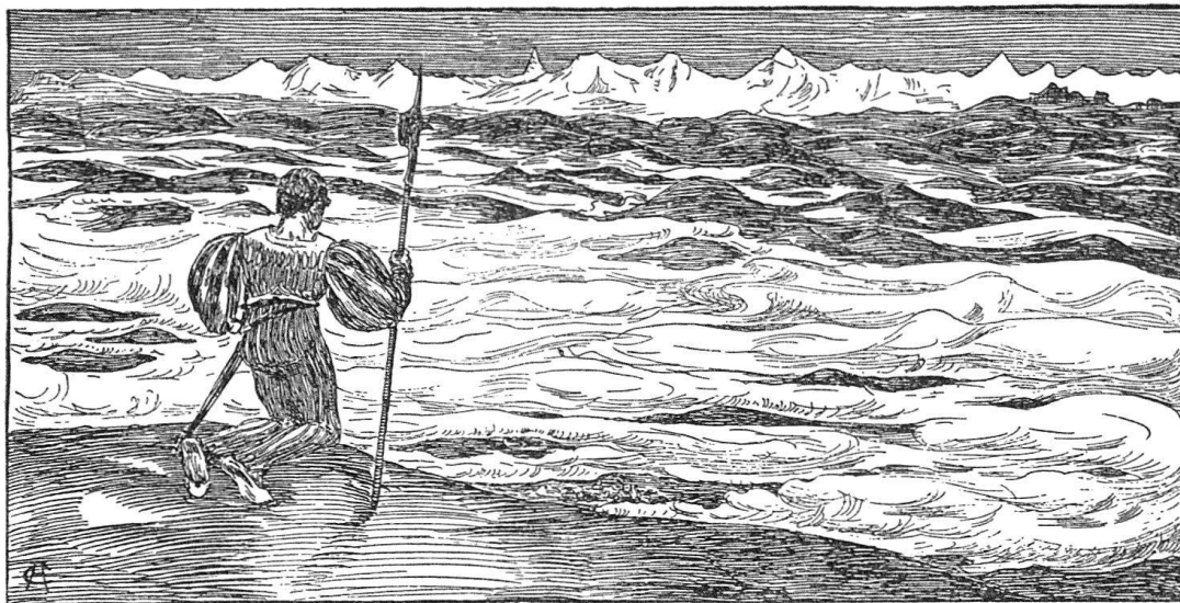
Cuno Amiet (1901). Huldigung.

schließen, sie erfordert demnach eine Berichtigung. Bestätigt wird, wie wir mit Freuden sehen, die Wahrnehmung, auf die wir glaubten, am Schlusse als auf einen Fund hinweisen zu dürfen: Cuno Amiets stille Neigung für geschichtliche Vorwürfe. Ohne sie wären diese prächtigen Darstellungen kaum entstanden. Wir können es uns nicht versagen, zwei der (wer würde dies heute noch glauben!) ihrer Zeit weit vorausseilenden Zeichnungen wiederzugeben, die zeigen, daß der Höhenflug des damals noch jungen Künstlers ihn