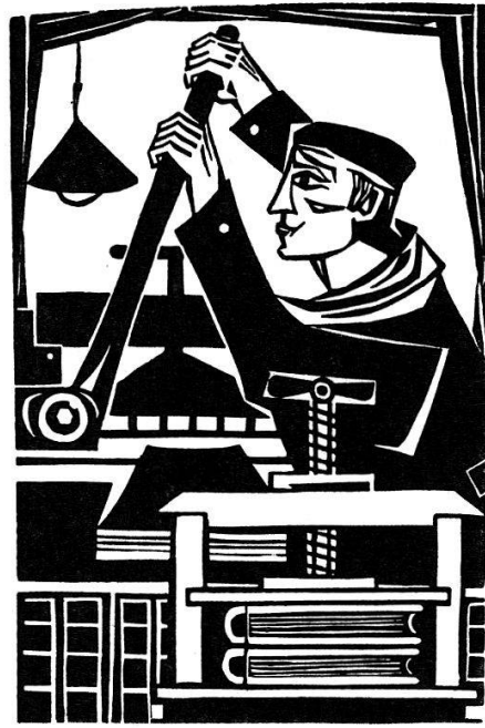
Verleger druckt das Werk