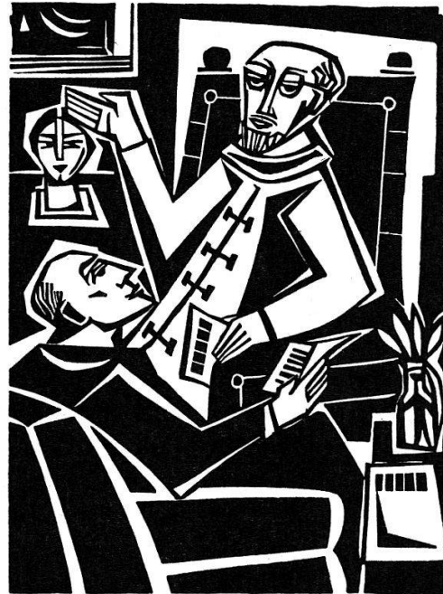
Erasmus hält Gelehrte auf dem Laufenden

am Main, erschienen. Der thematische Einfall ist originell, die Durchführung steht unter dem Einfluss der expressionistischen Kunst Frans Masereels. Die Reihe zeigt die mannigfachen Schicksale des Buches auf dem Weg vom Autor zum Verleger und