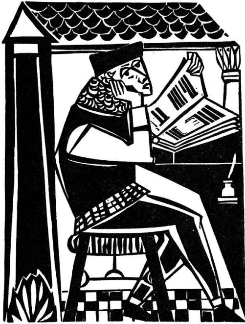
Erasmus prüft Buch