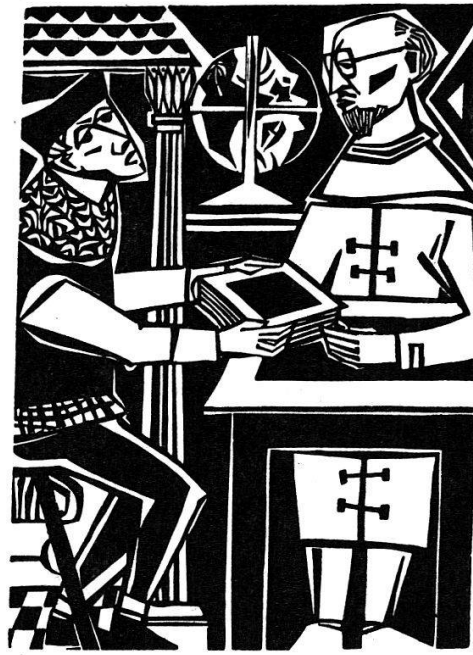
Und schickt es an Rezensenten