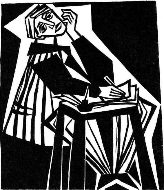
Der Autor schreibt ein Buch