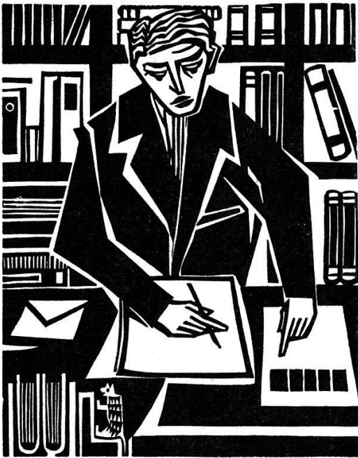
Bibliothekar bestellt Werke an Hand des Erasmus