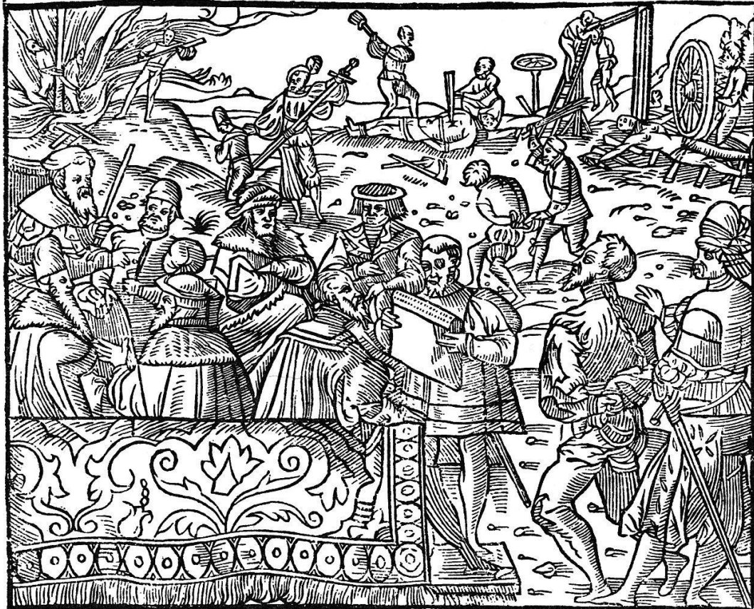
Les peines de mort et ceux qui les infligent, d'après le «Peinlich Halssgericht des Allerdurchlauchtigsten, Grossmächtigsten, Unüberwindlichsten Keyser Carolus des Fünfften...», Francfort 1609

sont un signe caractéristique de l'esprit nouveau qui se forme au passage du 17 e au 18 e siècle. Bien qu'il néglige un peu les belles-lettres, notre châtelain possède aussi les trois classiques Boileau, Bossuet et Racine. – Les énormes in-folio, les œuvres de Cats, sont probablement un souvenir