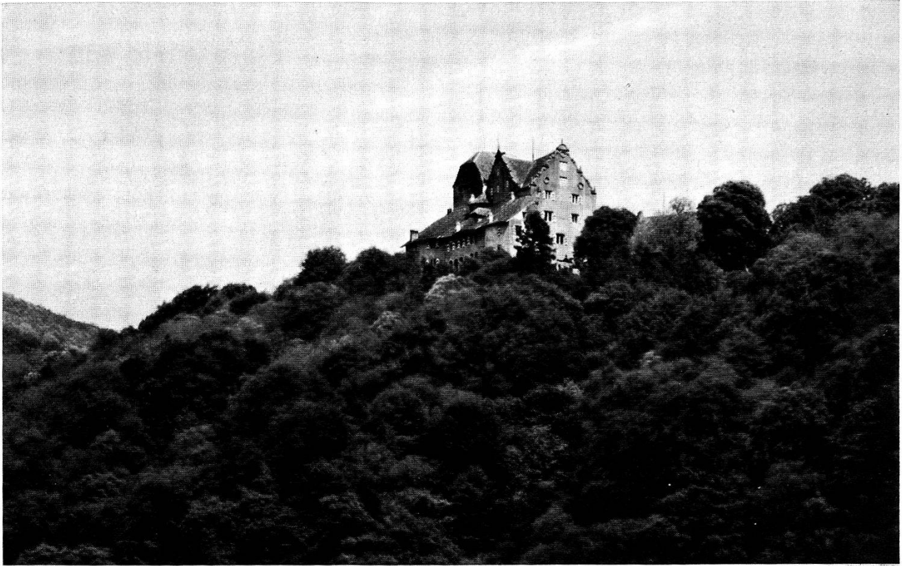
Le château de Wildegg (Argovie)