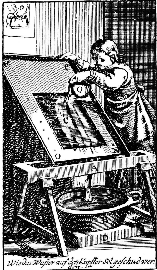
Wie das Wasser auf das Kupffer-Sol geschudt wer. Gen.