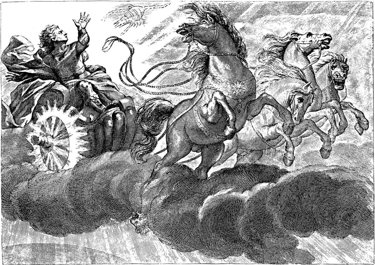
Phaëton, emporté par les chevaux du char du Soleil. Une des gravures dans le premier tome des Métamorphoses d'Ovide, en latin et en français (traduction de l'abbé Banier, Amsterdam 1732)