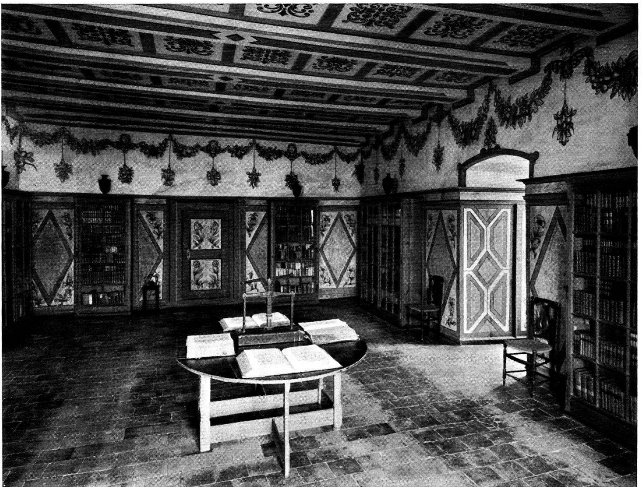
La bibliothèque du château