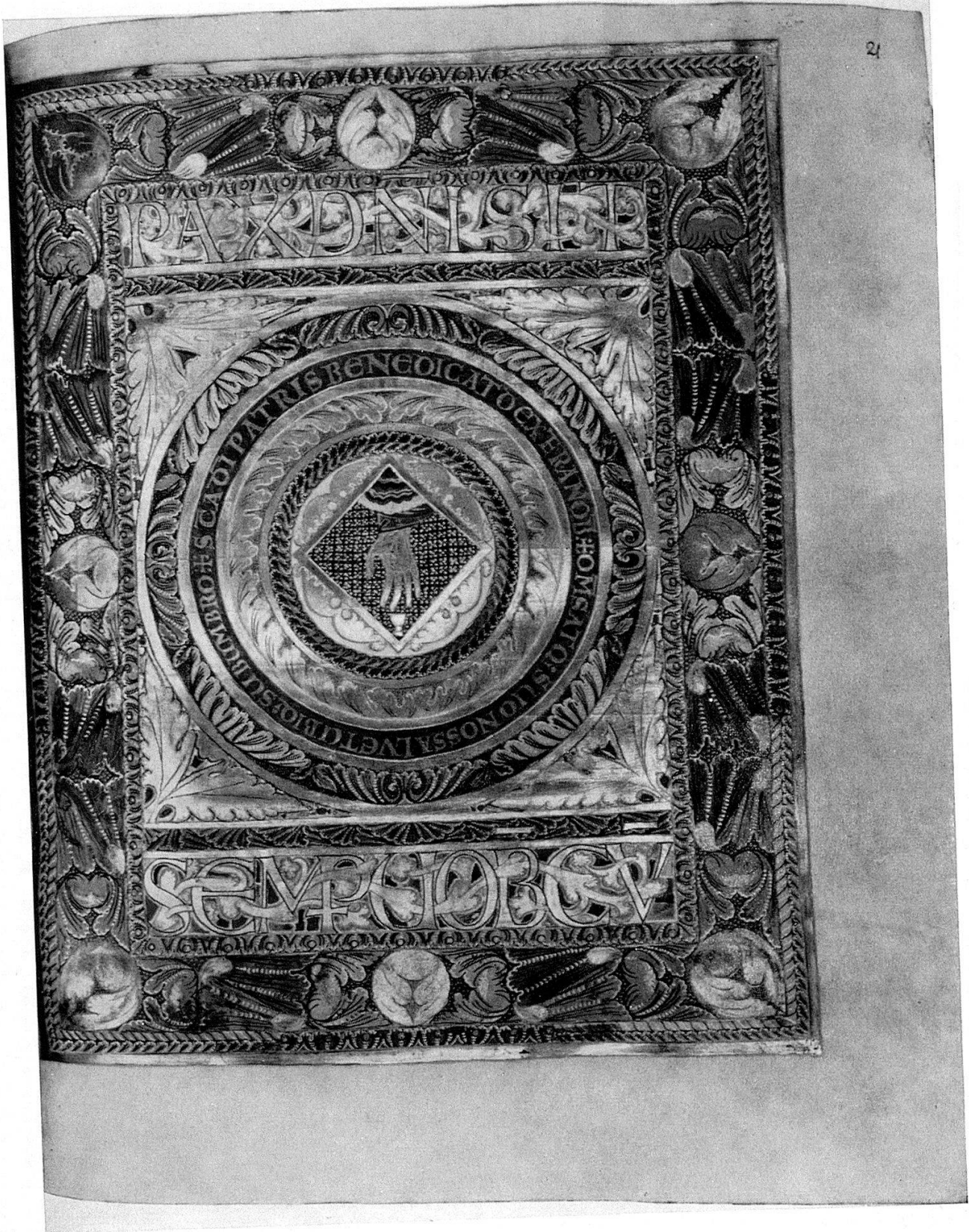
5 Sakramentar Heinrichs II. Zwischen 1002 und 1014