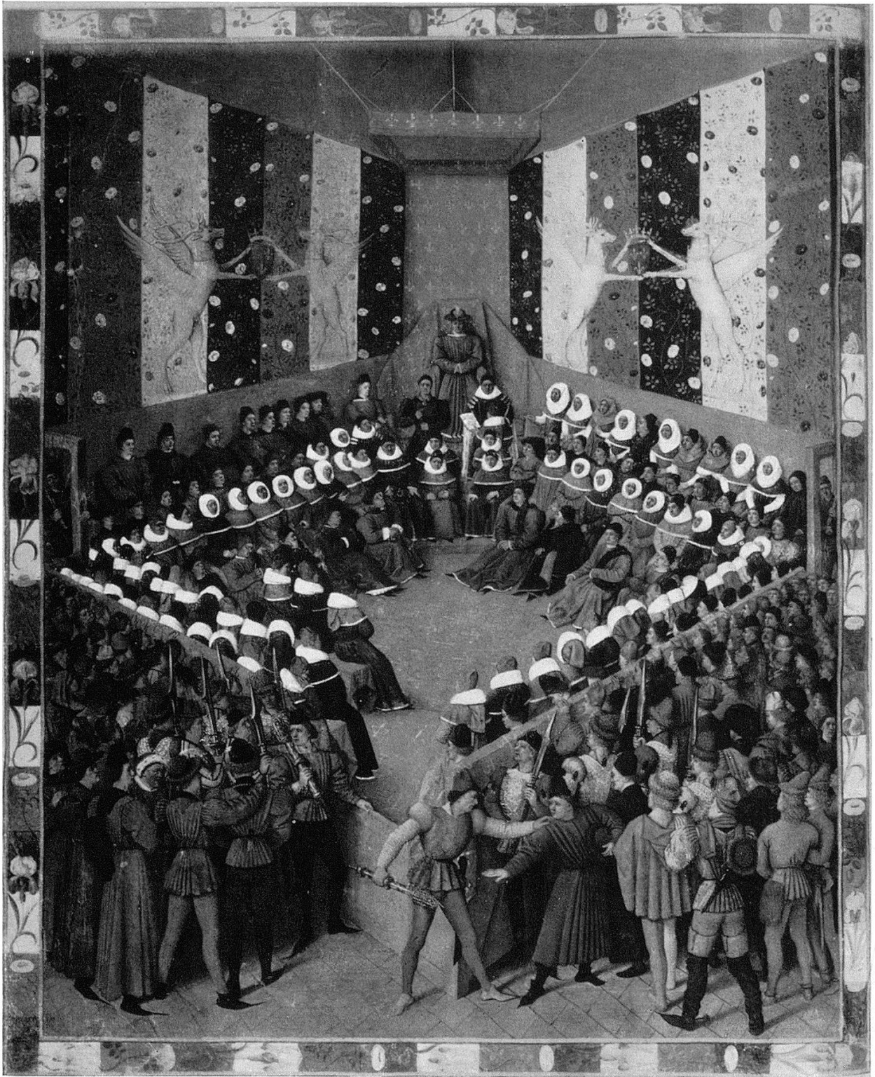
10 Boccaccio, mit Miniaturen von Fouquet. 1458