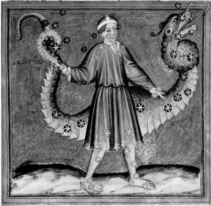
8 Astrologische Handschrift für König Wenzel. Ende des 14. Jahrhunderts