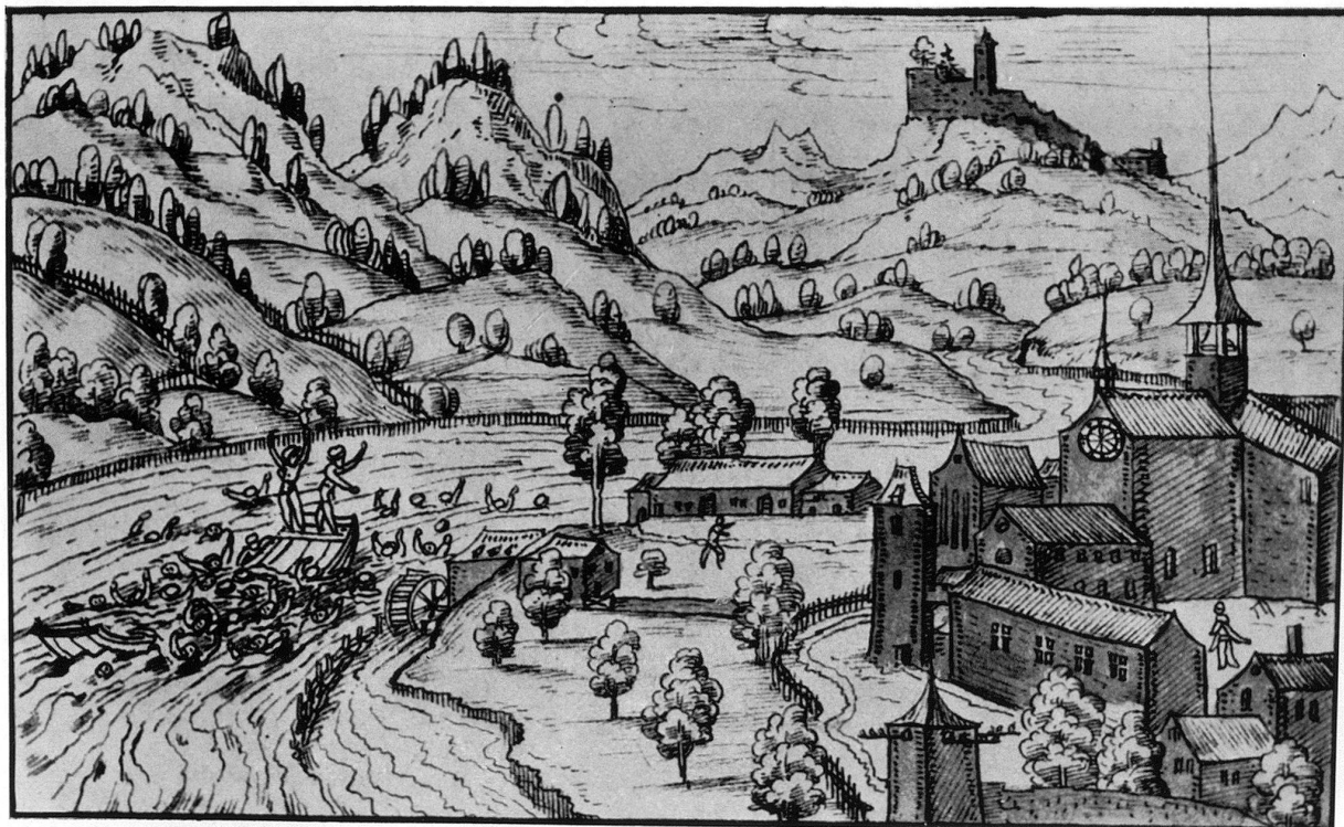
4. Christof Silberisen: Schweizer Chronik. Ansicht des Klosters Wettingen von Nordosten. Die Ansicht zeigt den Zustand (um 1572) vor den großen Umbauten des 17. Jahrhunderts. (Ms. f 16, Bd. 1, fol. 802 r)