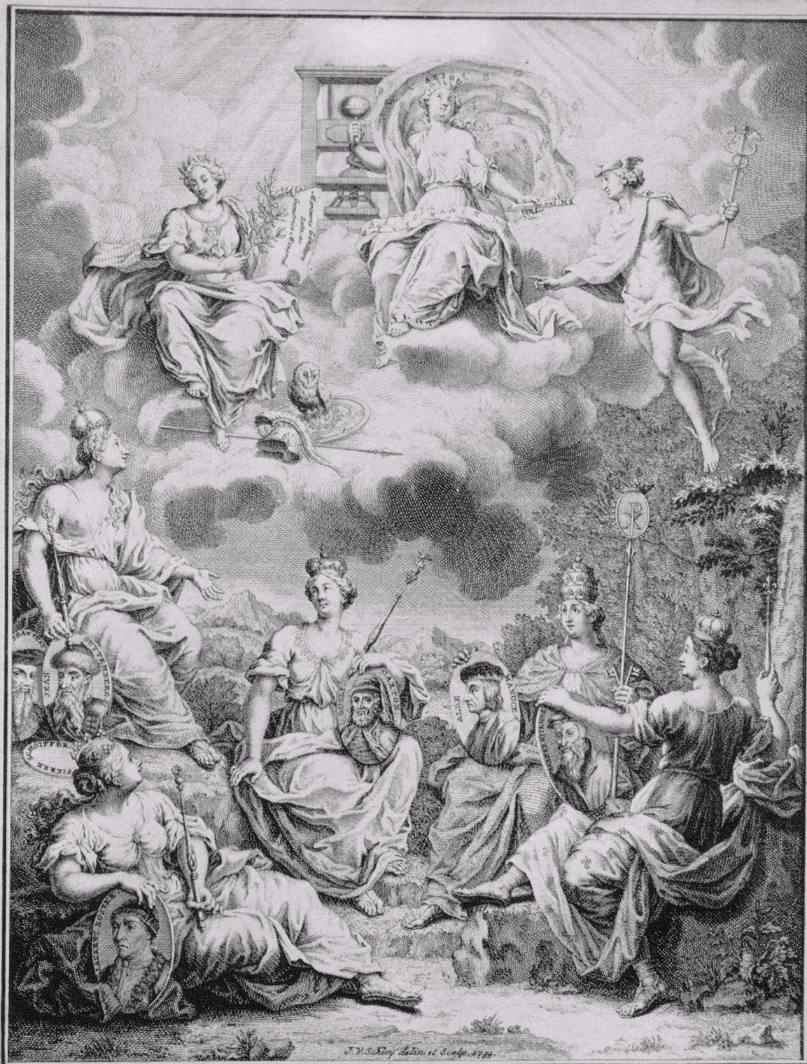
L'IMPRIMERIE, descendant des Cieux, est accordée par Minerve et Mercure à l'Allemagne, qui la présente à la Hollande, l'Angleterre, l'Italie, & la France, les quatre premières Nations chez les quelles ce bel Art fut adopté