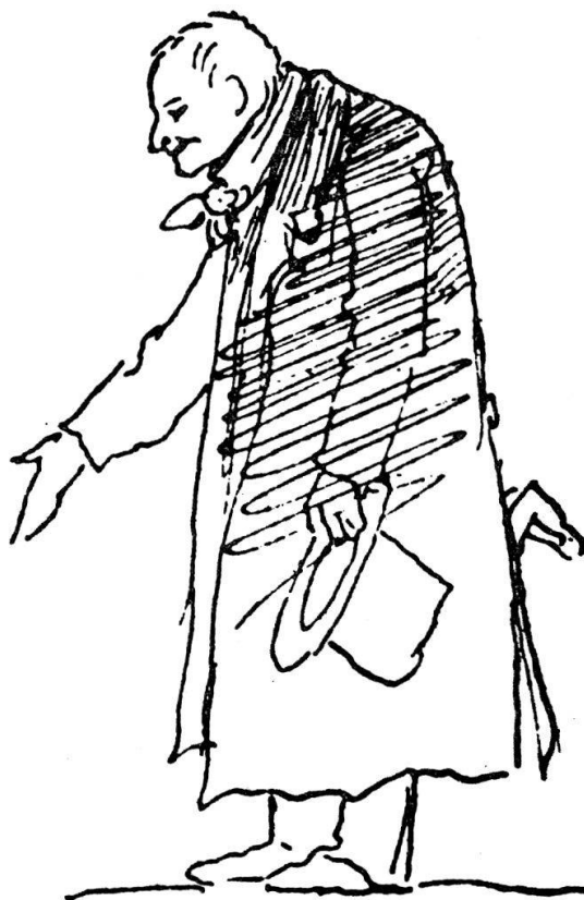
Alexander von Humboldt. Dessin de Wilhelm v. Kaulbach, 12 août 1848.

Il était dans mes projets de rédiger une biographie pénétrante d'un savant véritablement humain. Depuis 1948, j'avais commencé avec circonspection à m'ap-