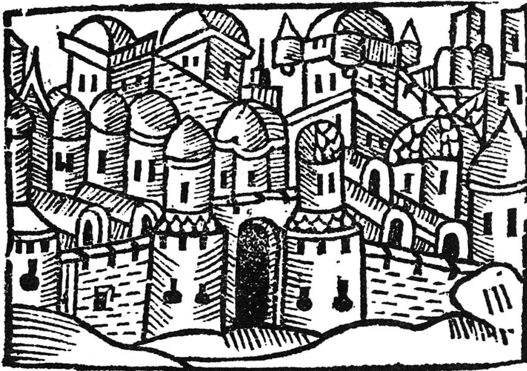
Eine phantasievoll entworfene Stadt mit orientalischem Einschlag (vielleicht Jerusalem) aus dem « Fasciculus temporum ».