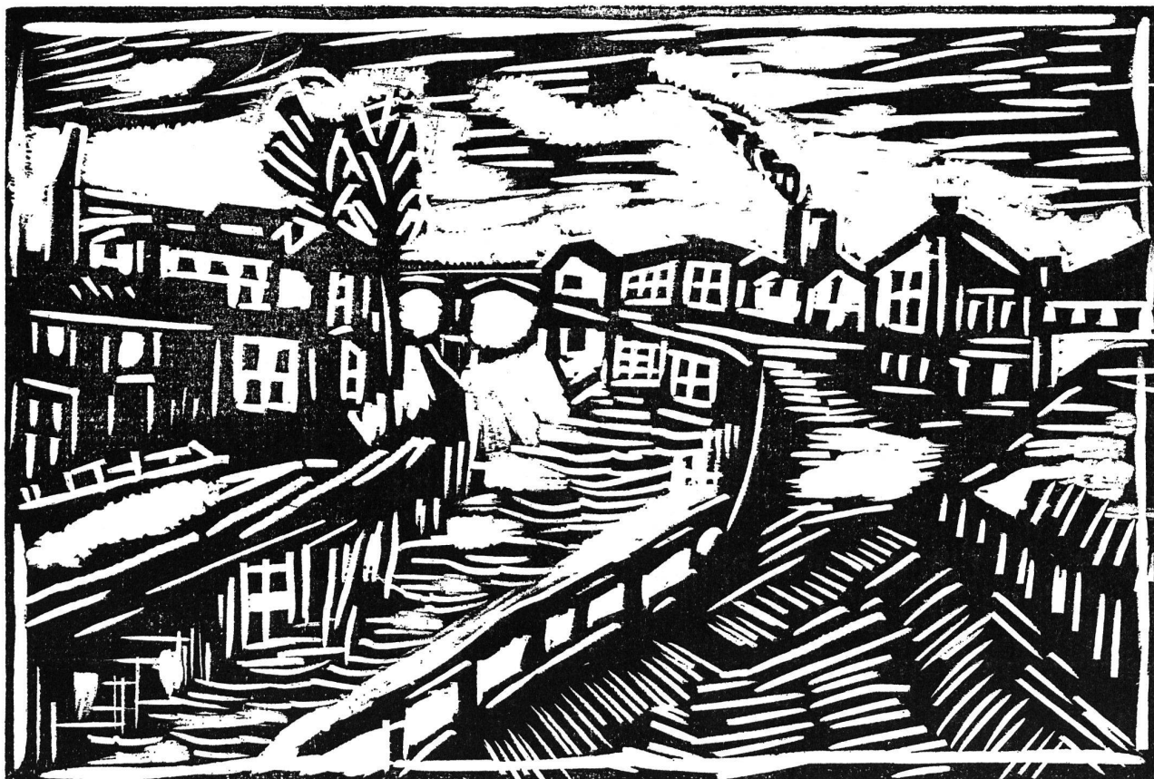
Holzchnitt aus «Voyages», Paris 1920