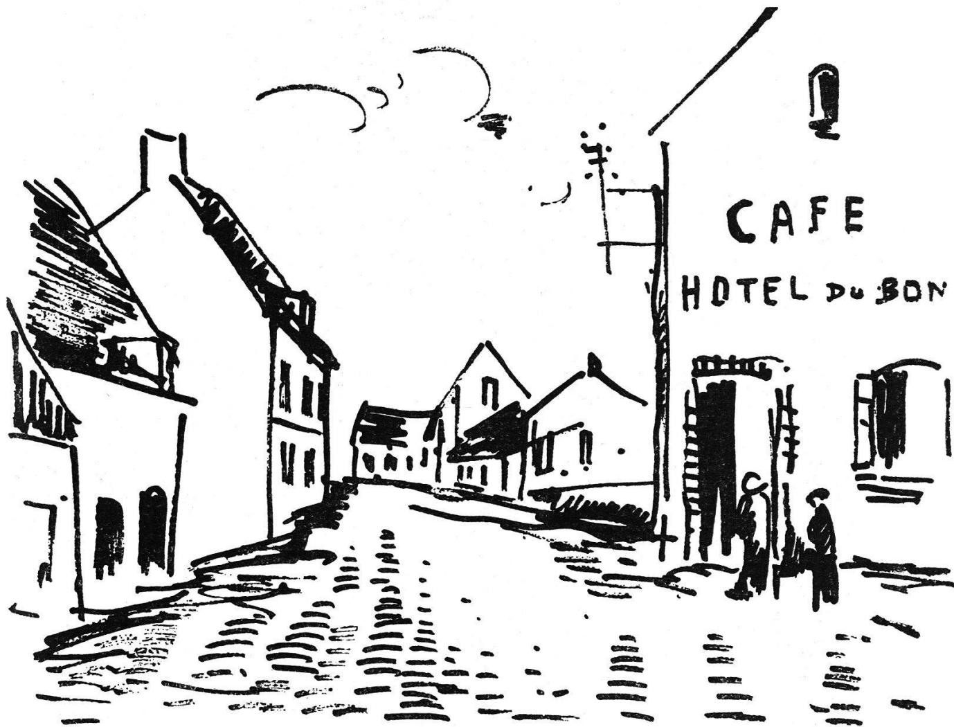
Lithographie aus «Grasse Normandie», Paris 1920