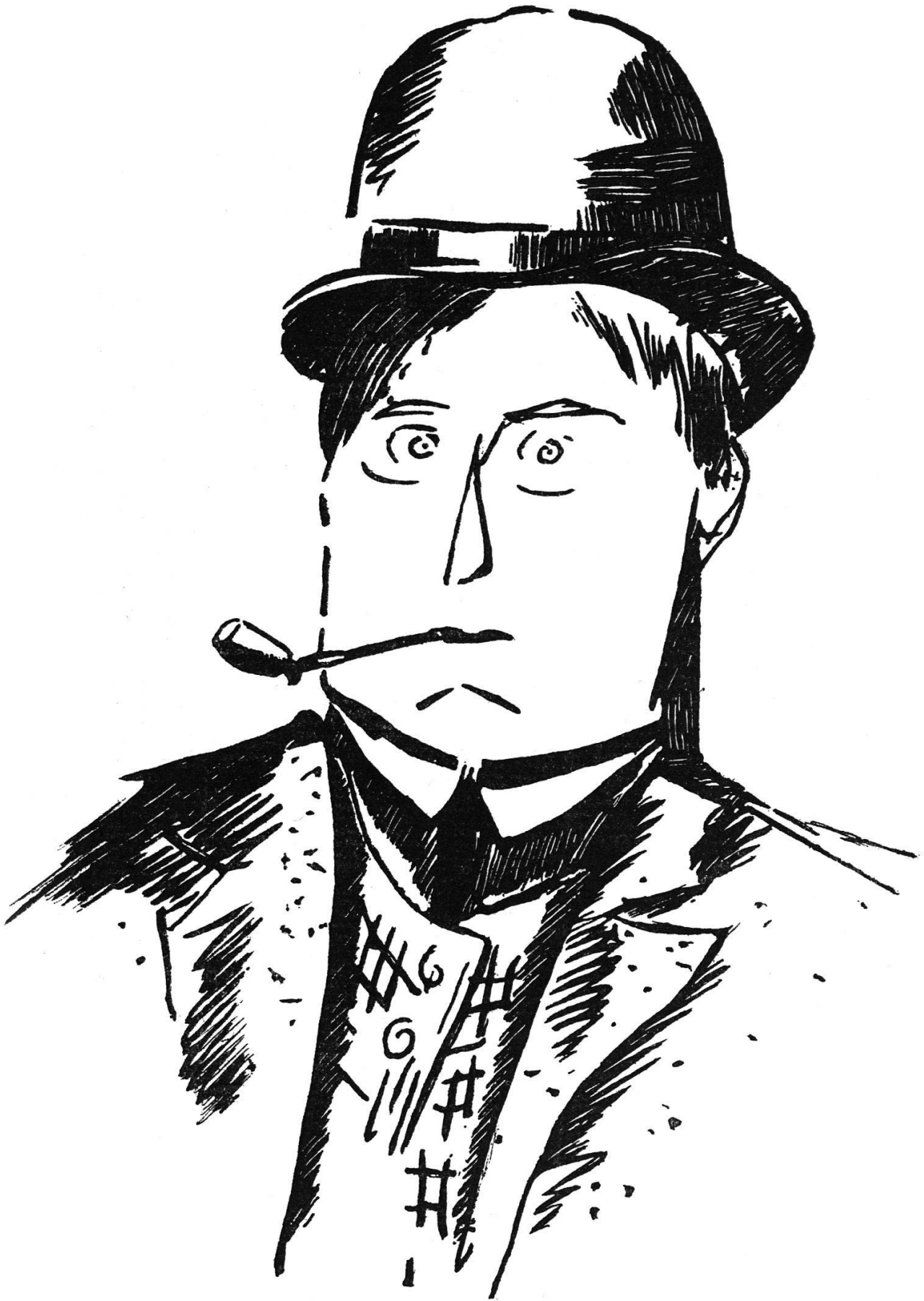
Maurice Vlaminck, Selbstbildnis, Radierung, 1908