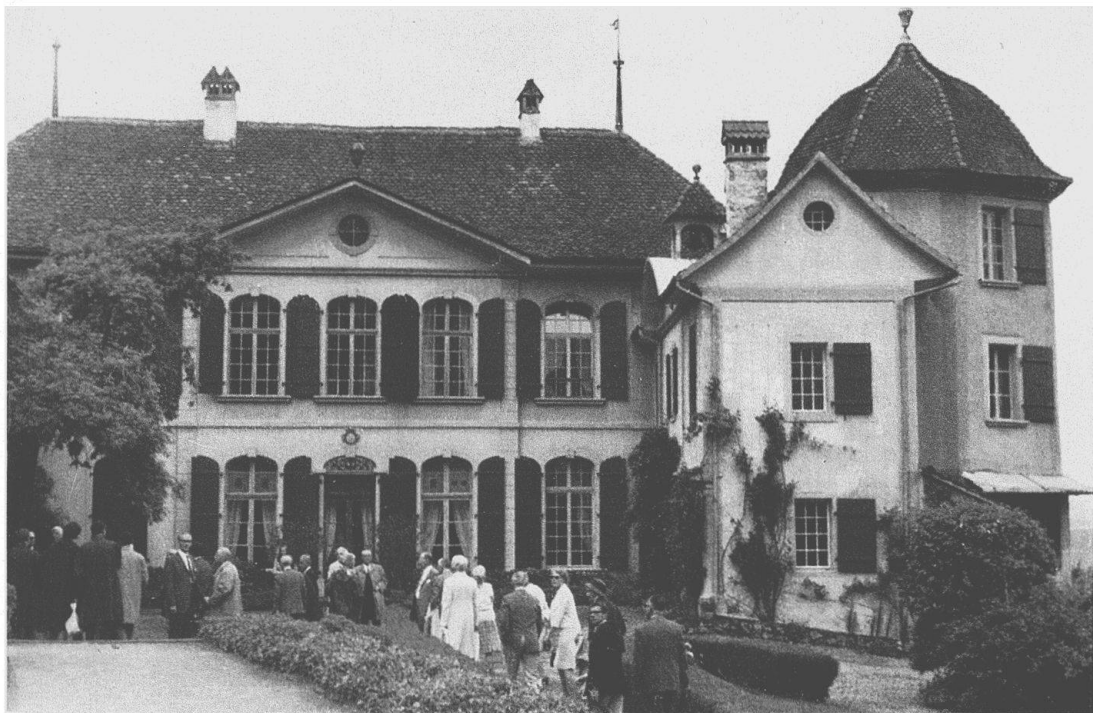
Schloß Toffen im Gürbetal mit seiner reizvollen, im Turme rechts untergebrachten Bibliothek