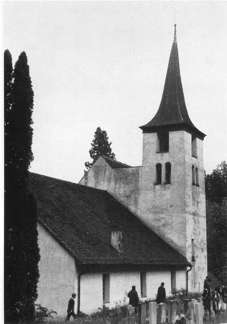
Die eine Gruppe der Teilnehmer besuchte auf dem Weg nach Toffen die materisch gelegene Kirche von Blumenstein