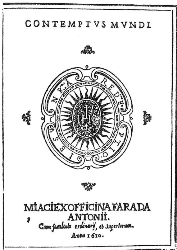
Missionsbuch der portugiesischen Christen. Bücher dieser Art sind begehrte Sammelobjekte. Pappdeckeleinband. Kupfertypendruck in Nagasaki, 1610.

«MISSION IN OSTASIEN»-ARCHIV (Tenri-Bibliothek in Nara-Tenri). Diese Sammlung basiert hauptsächlich auf den Missionsbüchern, die man im 16. und 17. Jahrhundert in Ostasien benutzte (etwa 2000 Titel). Außer-