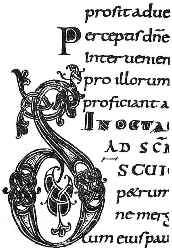
Eine Initiale aus der Handschrift 191 (Sakramentar aus dem 9. Jahrhundert, vermutlich nach irischem Vorbild im Kloster St. Gallen ausgeführt).

Die bedeutendste Handschrift in der zweiten Vitrine ist ein Breviarium (Codex 309) – die am reichsten ausgestattete Handschrift in der Donaueschinger Sammlung. Ihrer künstlerischen Herkunft nach stammt sie aus einer klösterlichen Schreib- und Malschule im Bistum Hildesheim und wurde etwa um 1220 bis 1230 fertiggestellt. Der Stil der Miniaturen ist von byzantinischen Vorbildern beeinflusst und war speziell in Mitteldeutschland und Westfalen beheimatet. Die Kunstgeschichte nennt ihn Zackenstil. Bemerkenswert ist auch der Silbereinband mit vergoldeter Treibarbeit als Mittelstück und Medallions mit Darstellungen der Evangelisten am Vorderdeckel und der Evangelistensymbole am Rückdeckel. Die im 14. Jahrhundert angebrachten Schließen tragen das Werdenbergische Wappen in farbiger Emaillearbeit.