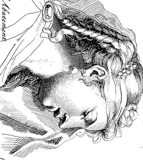
Le Dieu inventeur