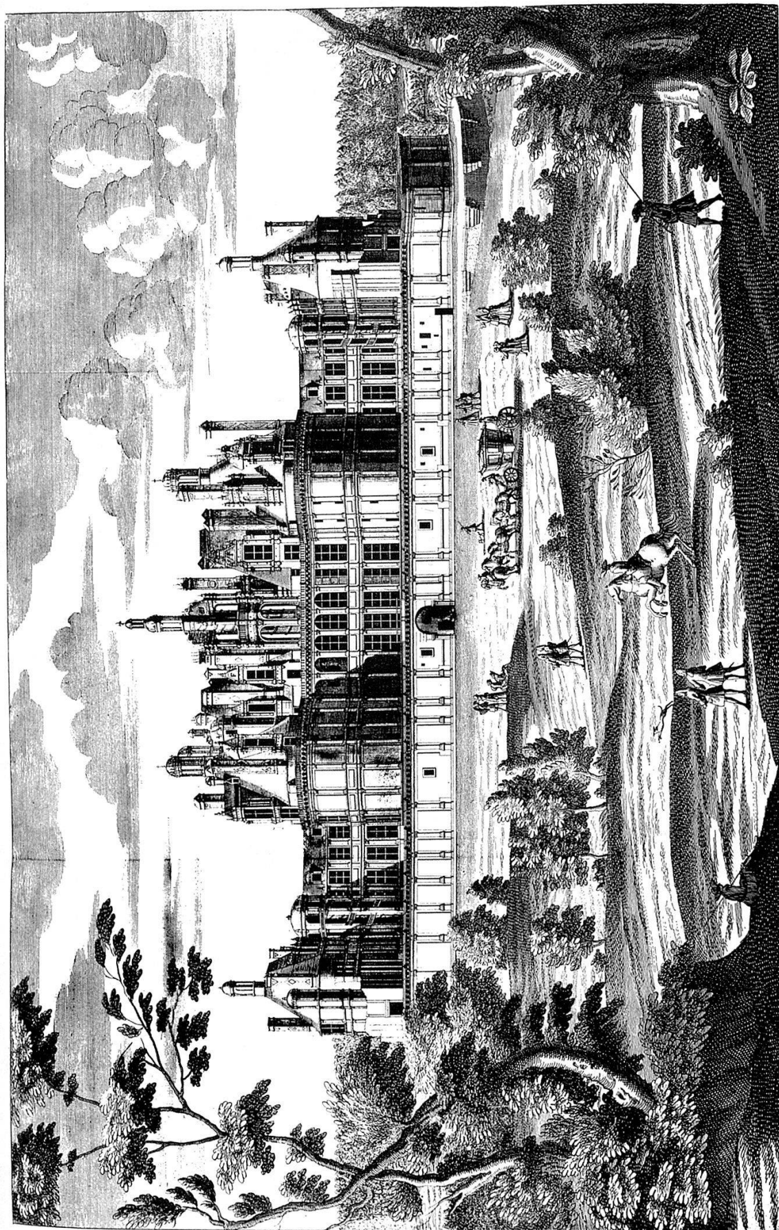
VUE DE CHAMBOR, Maison Royal de France, dans le Blois, à trois ou quatre lieues de Blois, du côté d'Orléans. Le Roy François I. y fit commencer un peu avant sa mort, et le Roy Henry II. y fit achever. Chambor est situé au milieu d'un grand parc, sur le bord de la petite rivière de Cousson, qui, l'année presque tous quatre, amène merveilleux le corps du château, et veut au milieu en exalter admirable fait en coquille, avec deux montées au dessus. L'un de l'autre, ou plusieurs personnes peuvent monter, sans se voir, l'un qu'elle n'avoient parler ensemble.

Gravé par A. Audouin et se vend chez les Bâtes de Paris par la Rue de la Harpe.