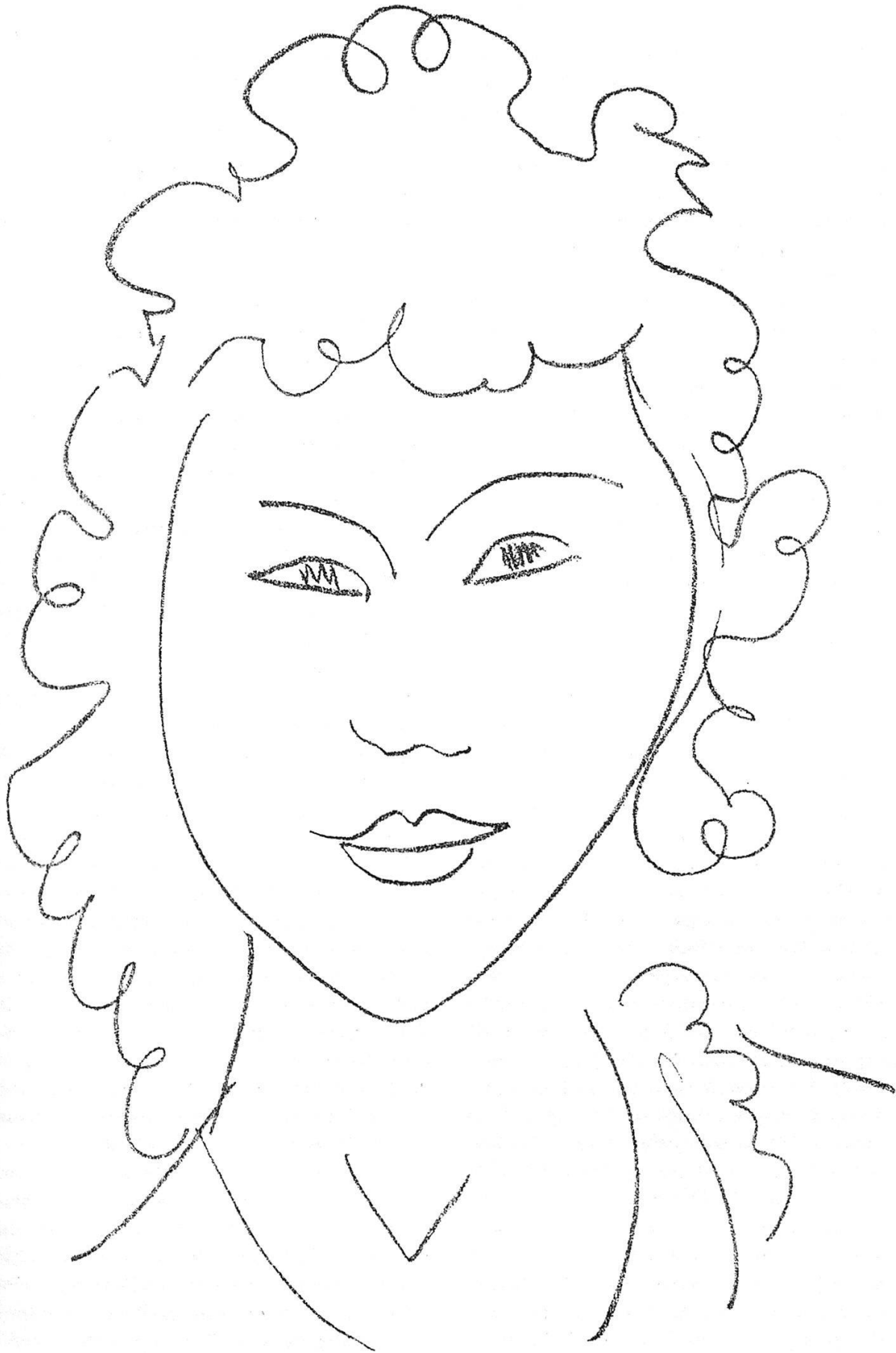
L'une des lithographies originales inédites de Matisse pour les « Poésies antillaises » de J. A. Nau.