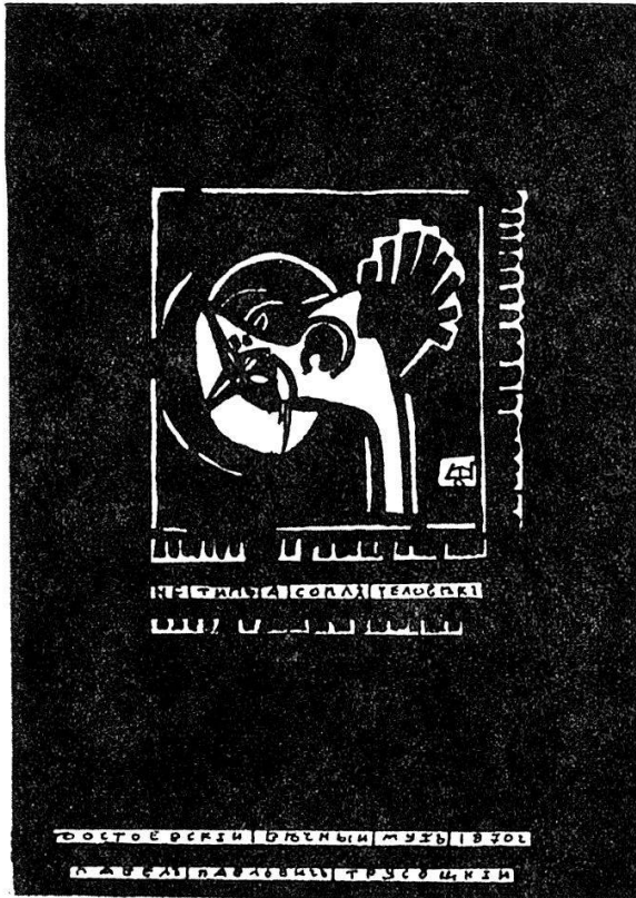
II [2.] «Der Verrotzte» («Der ewige Gatte», 1870). – Text: «Pawel Pawlowitsch Trusotzkij» (Name des Protagonisten). Stark verkleinert.

Michail Schemjakin, dessen kalligraphische Inventionen und Illustrationsfolgen zu Werken Gogols, Dostojewskijs, Solschenizyns un-