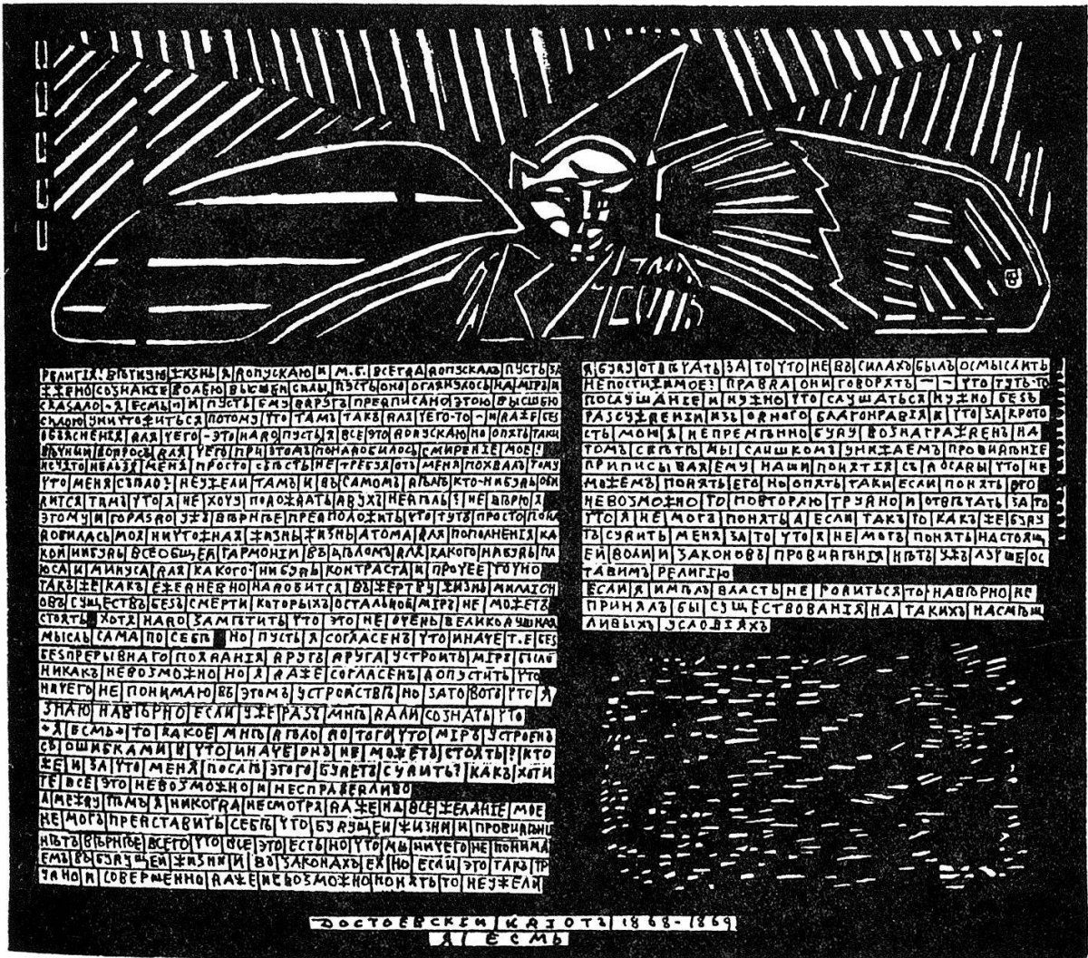
IV [10.] «Ich bin» («Der Idiot», 1868–1869). – Text: Religionsphilosophische Reflexion über den Sinn der menschlichen Existenz; über die «ewige Frage», wozu es der Demut vor einer höheren Macht bedürfe, die sich der Erkenntnis entzieht; über das Problem des Glaubens und der Vorsehung, der Verantwortung und der Schuld: «... kann ich denn wirklich dafür verantwortlich gemacht werden, daß ich nicht in der Lage war, das Unergründliche zu ergründen?» [Kapitel III, 7].

Auch diese innere, ein halbes Jahrhundert überbrückende und überdauernde Verwandtschaft zweier bedeutender Autoren – nicht bloß Remisows Arbeit als eigenwilliger Zeichner und Illustrator – soll hier durch eine Bildauswahl (10 von 25 Tafeln) sowie ein kalligraphisches Blatt vergegenwärtigt werden. Daß die Illustrationen, im Gegensatz zu den meist abstrakten Konstrukten der Remisowschen Traumbilder, fast durchweg figürlich (als imaginierte Porträts oder Skizzen literarischer Gestalten) gegeben sind, hängt wohl mit der spezifischen bildnerischen Aufgabe zusammen, die sich der