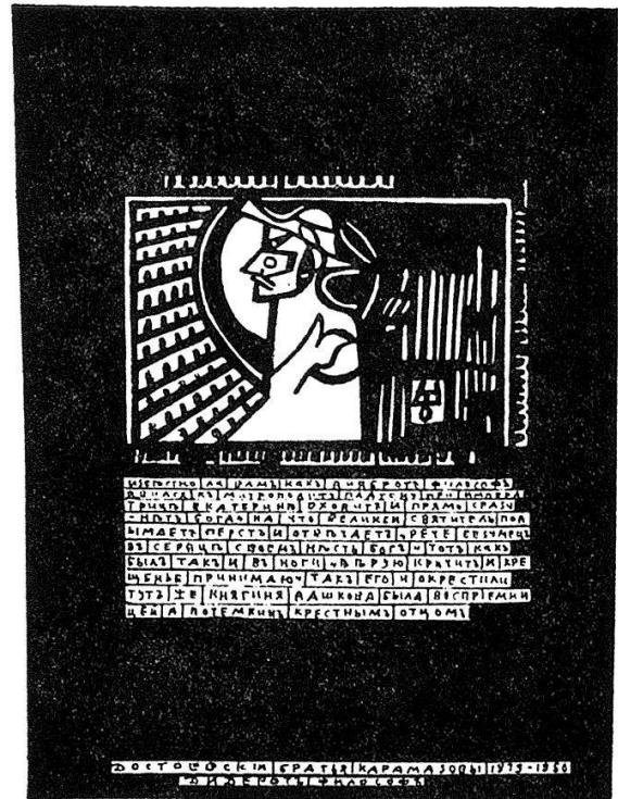
X [22.] «Der Philosoph Diderot» («Die Brüder Karamasow», 1879–1880). – Text: Über die Taufe des atheistischen «Toren» Diderot [Buch I, Kapitel ii, 2]. Stark verkleinert.