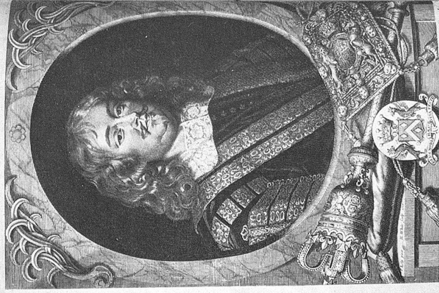
Edward Earl of CLARENDON, Lord High CHANCELLOR of England, and Chancellor of the University of Oxford, &c. &c. &c.

O X F O R D, Printed at the THEATRE, An. Dom. MDCCL.