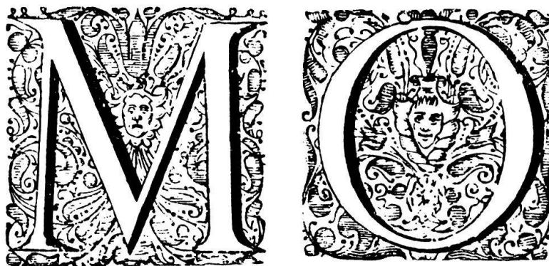
Fig. 97. Verzierte Initialen Nr. 22 der Schriftgießerei Blaue.

Type Specimen Facsimiles . 2 Bde. Hrsg. John G. Dreyfus. Bd. 1 (1–15) mit einer Einleitung von Stanley Morison. Boves & Boves and Putnam, London 1963. Bd. 2 (16–18) The Bodley Head, London 1972.