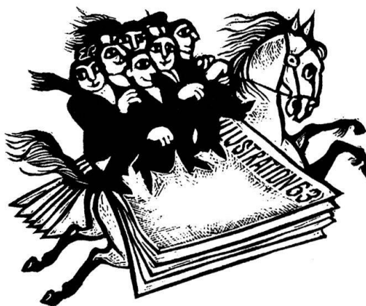
Linolschnitt von Eduard Prüssen, Köln.

Seit zehn Jahren erscheint gleichfalls bei Visel die Graphische Kunst , deren Thema ausschließlich die Druckgraphik ist und die