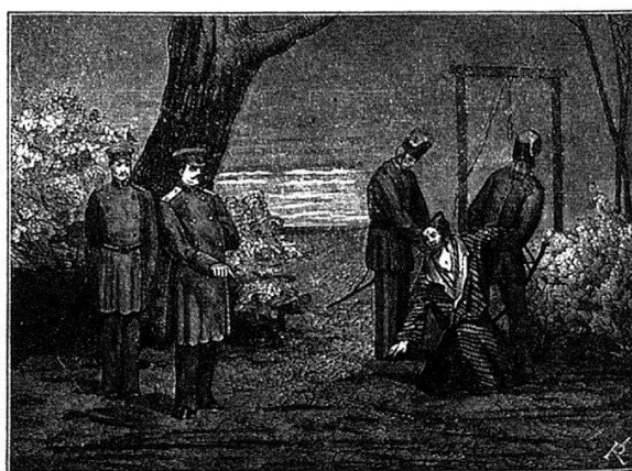
Казакѣ тащатъ жида на висѣлицу.

Reinen Sensationscharakter, ohne gesellschaftskritisches oder auch nur antinihilistisches Etikett, hat V. Toporkovs zweiteilige Chronik Ubijcy, grizetki, katoržniki i buntovščiki, ili Tipy truščob temnogo i belogo carstva (Mörder, Grisetten, Sträflinge und Aufrührer, oder Typen aus der Unterwelt des dunklen und des hellen Reiches), die 1881 bei der Verlagsbuchhandlung Leuchin in Moskau veröffentlicht wurde. Die beigefügten sieben Bildtafeln vermitteln einen deutlichen Vorgesmack der 500 Seiten füllenden haarsträubenden Faits divers . Der Umstand, daß weder die Literaturgeschichten und -lexika noch die einschlägigen Bibliographien klärende Hinweise auf den Autor und sein Werk enthalten, läßt gewisse Rückschlüsse auf Rang und Qualität zu. Bedenkt man, wie wenig den Zeitgenossen an der Bewahrung und Überlieferung von dergleichen Literatur gelegen war und zu welchen Preisen mitunter solche Kuriosa auf dem antiquarischen Markt angeboten werden, freut man sich über diesen seltenen Fund. Der Verlag Leuchin hatte übrigens im selben Jahr eine eben-