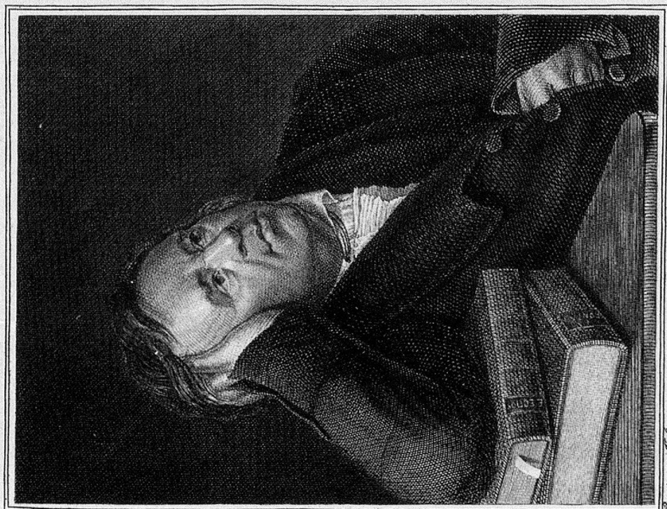
Крыловъ въ старости.