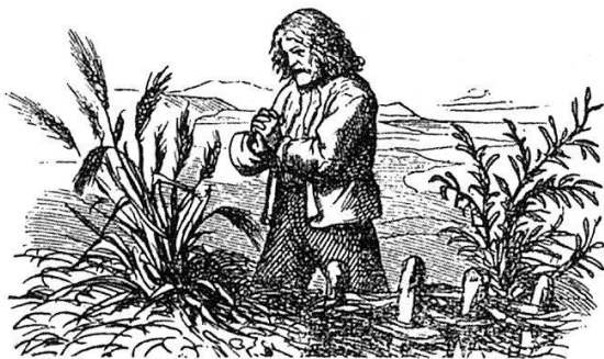
Sa 55 drvorezah