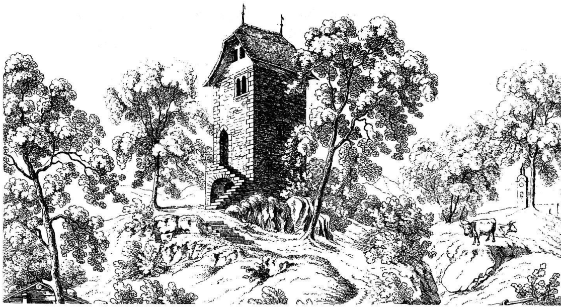
Untere Burg von Sarnen, heute Archivturm, Lithographie, 1841 (Ausschnitt).

dentensteinstuhl das in Gold gefaßte Kruzifix, ein Geschenk des Konstanzer Bischofs. Abschließend wurden wir mit dem Verlauf der Landsgemeinde als der immer noch bewährten, lebendigen, aber nicht immer unbestrittenen Form von direkter Demokratie vertraut gemacht.