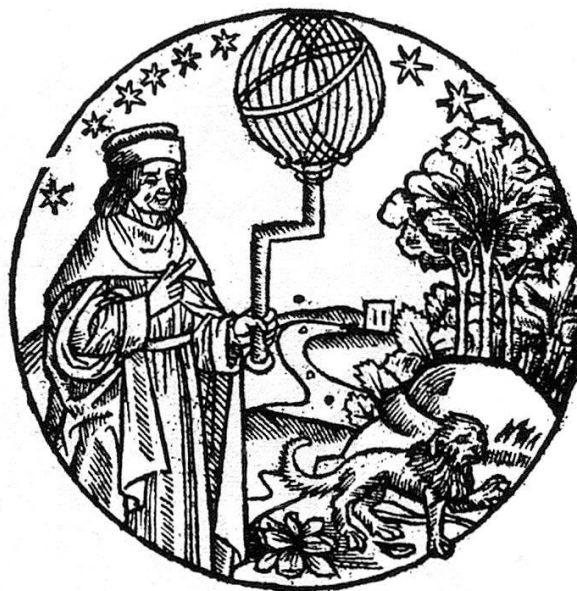
«Grand astrologue très expert» (La pronostication de Pavie)

sera disposé à paix qui ne lui fera guerre» ou, mieux encore, «cette année Mars montrera sa fureur». Exercice périlleux, en effet, car l'époque fut agitée par de nombreuses guerres, par la menace que représentait le Turc. A cela s'ajoutèrent encore des dissensions d'ordre religieux, l'avènement de