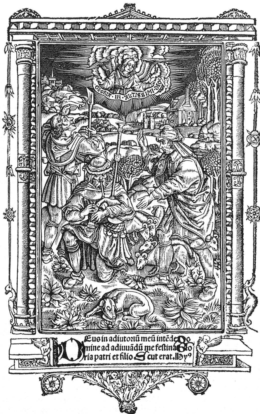
9 «Liber horarum ad usum lausannensem». Paris: [Philippe Pigouchet pour] Simon Vostre. [1507]. In-8°. BCUF, Rés. 1, fol. e 7r.

règle caractéristique des ordres réformés: il serait vain d'y chercher des manuscrits à miniatures, or et couleurs, depuis la décision du chapitre général (en 1152) de renoncer aux miniatures et d'utiliser les couleurs avec parcimonie. Les manuscrits conçus dans le scriptorium de l'abbaye cistercienne d'Hauterive, fondée en 1138 près