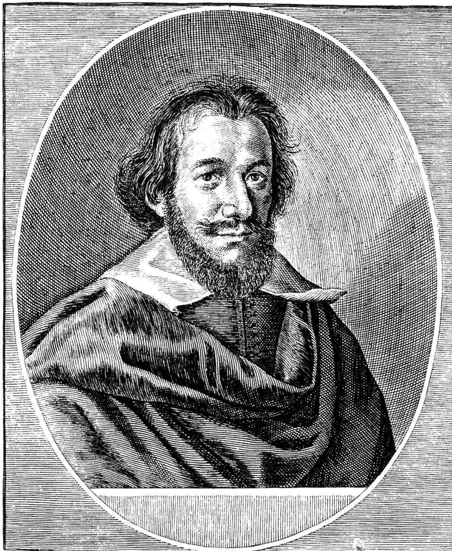
Bildnis von Matthäus Merian d. Ä. Kupferstich (16,2 × 11,2 cm) von Raphael Custos nach einer Zeichnung von Matthäus Merian d. J., um 1630. Schweizerisches Landesmuseum Zürich.

sagen – soweit sie als solche zu erkennen sind – gesondert herauszugeben und zu kommentieren. Diesem nicht leichten Unterfangen wird hier ausgewichen, weil die Grundsätze, die zu einer voll befriedigenden editorialen Form führen, noch nicht gefunden und festgelegt sind 1 und weil die da-