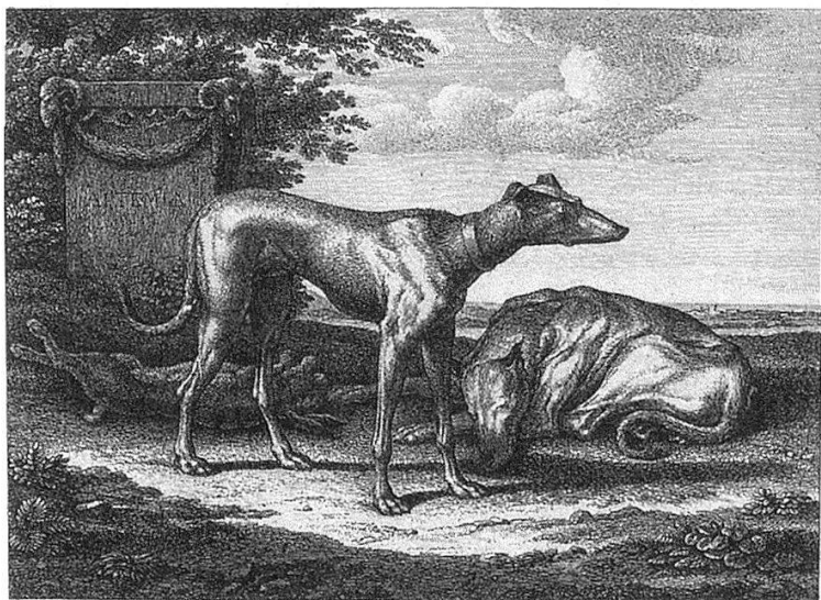
«Zwei Windhunde bei einem toten Hasen», 1828, 18,7×26,7 cm (Darstellung), Staatliche Museen zu Berlin – Preussischer Kulturbesitz, Kupferstichkabinett.

nen in Sturm-und-Drang-Manier die Freiheit als zentrales Anliegen. In ihnen drückt sich seine Unzufriedenheit mit der eigenen Situation am Hofe aus, obwohl ihn der Herzog außerordentlich schätzte und er zahlreiche Privilegien besaß. Inwieweit die Gedichte in Meiningen bekannt waren, läßt sich nicht entscheiden. Falls der Herzog von ihnen wußte, betrachtete er sie jedenfalls nicht als persönlichen Angriff 6 .