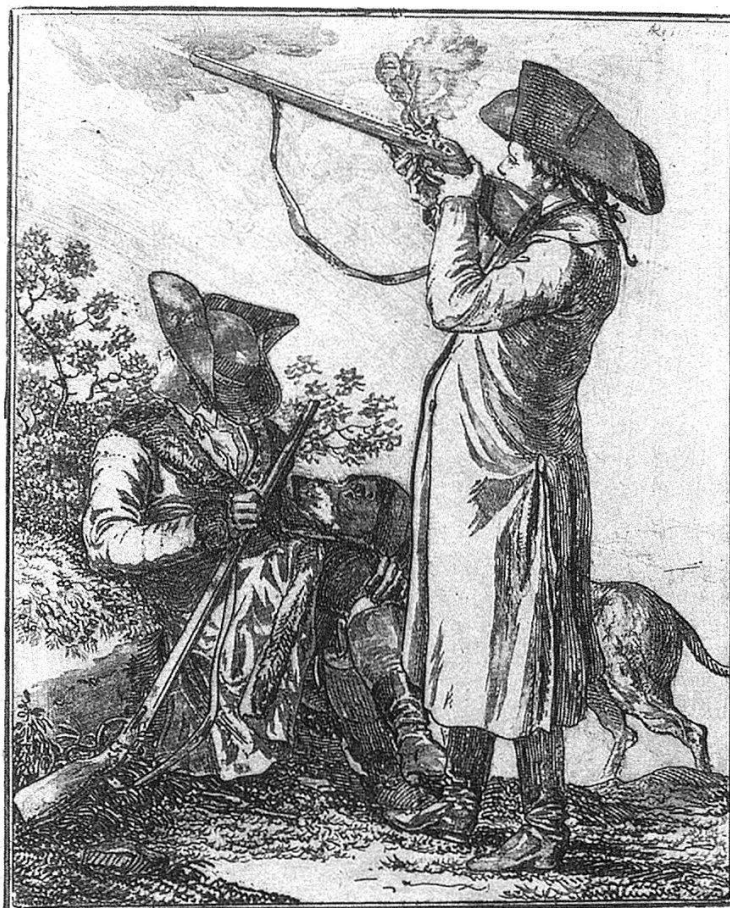
«Die beiden Jäger mit dem Hund», 1786, 15,1 × 12,1 cm (Darstellung), Staatliche Museen zu Berlin – Preussischer Kulturbesitz, Kupferstichkabinett.

verkündet 18 .» Der Brief stammt aus der Zeit, als Reinhart schon bayerischer Pensionär war, von König Ludwig I. gefördert wurde und gewisse Vergünstigungen erhielt. Dazu gehörte die kostenlose Zustellung eines Gewehres, das der befreundete Münchener Architekt Friedrich von Gärtner hatte anfertigen lassen. Es ist unbekannt, welche Radierungen Reinhart für den Gewehrmacher aussuchte, möglicher-