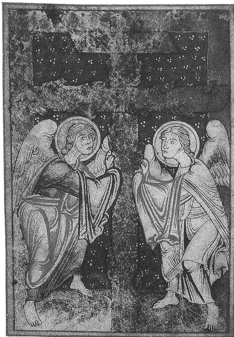
Seite 145: «Sehnsucht nach dem Herrn». Die großartige Darstellung mit den beiden Engeln unter dem Kreuz als Abschluss des ganzen Gebet-Bild-Zyklus.

heraus das Rösch-Gebetbuch entstanden ist. «Wollte der Fürstabt als wirkungsmächtiger Reformator seines Konvents wie des St. Galler Klosterstaates auch sein eigenes