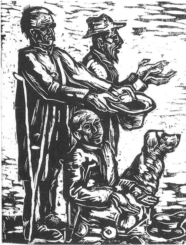
Bettler. 1938. Holzschnitt.

Querschnitt von Schwerins künstlerischem Schaffen der fünfziger und sechziger Jahre dar. Er zeigt sich nun auf der Höhe seiner Bestimmung – seine Arbeiten gefallen, werden ausgestellt und von Privaten wie