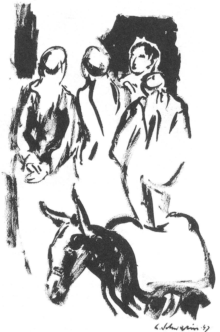
Straßenszene in Israel. 1947. Tusche und Pinsel. Bezirksmuseum Buchen.