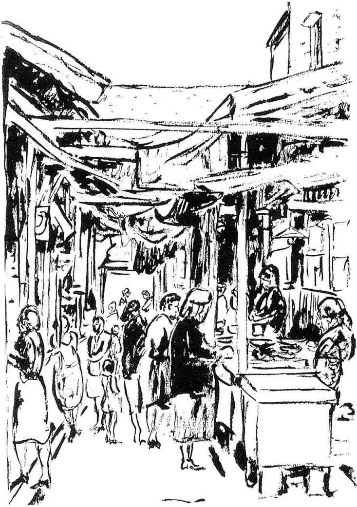
Auf dem Markt. Tusche und Rohrfeder. Bezirksmuseum Buchen.