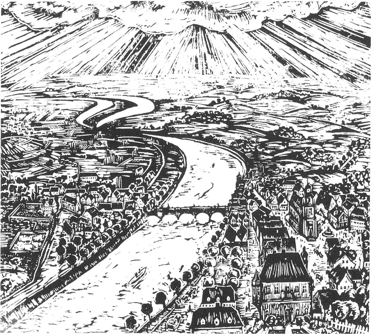
Große Flusslandschaft. 1928. Holzschnitt.

das Buch «Jahresringe» von Ludwig und seinem Bruder Alfred Schwerin herausgegeben, in welchem Texte sowie zuverlässige Verzeichnisse der literarischen und künstlerischen Werke des Malers enthalten sind. In der Zeitschrift «Der Wartturm. Heimatblätter des Vereins Bezirksmuseum Buchen e.V.» finden sich von Jahr zu Jahr neue Beiträge zu Schwerin. Endlich veranstaltete Helmut Brosch zu Schwerins 100. Geburtstag in Buchen eine erfolgreiche und beachtete Ausstellung, zu der ein