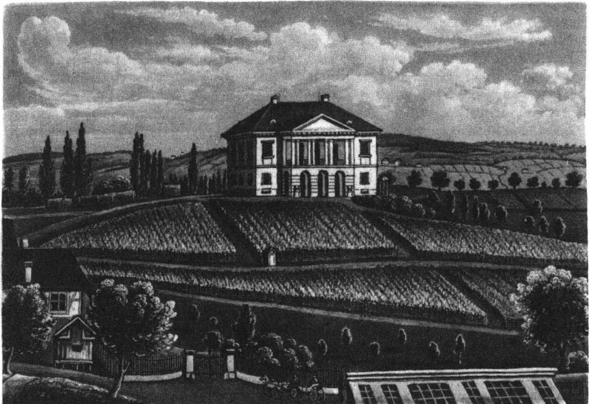
Der Landsitz Freudenberg in Zürich-Enge. Aquatinta von Heinrich Siegfried aus Hermann Trachslers Bilderfolgen «Zürich und seine Umgebungen / ein Almanach für Einheimische und Fremde», erschienen 1839–1841.

J'ai appris que vous aviez vendu le Muraltengut et acquis à Cologny une belle pro-