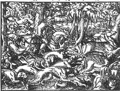
Bedruckt zu Franckfurt am Mayn bey Johann Feyerabendt/ In verlegung Sigmundi Feyerabendts. M. D. LXXXII.

Mit Röm. Kayf. Maiest. Freiheit nicht nach zu euden.