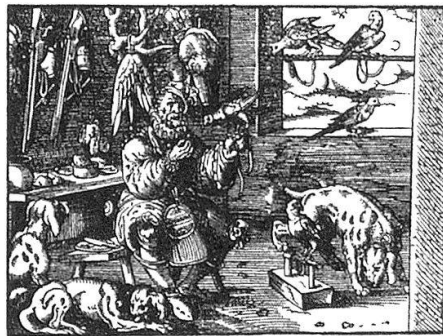
Bedruckt zu Franckfurt am Mayn/ durch Johann Feyerabendt/ In verlegung Sigmundi Feyerabendts. M. D. LXXXII.

Allen Fürsten/ Grauen/ Herrn/ Adelspersonen/ vnd allen andern/ hohes vnd niedriges Stands/ so diese löbliche Adliche vbung der Jag vnd Weyd- wercks/ lieb haben/ zu fordern Ehren/ lust vnd gefallen / auß Franckischer/ Italianischer vnd Teuff- scher Sprach/ bin vnd her in diese Ordnung zusamen gebracht vnd beschriben / Nach mit schöner hertlichen/ lebendigen Zeichnungen / so zuvor niemals geschrieben/ Nach mit schöner lauten/ salblich vnd nützlich zu lesen/ von newen in Teuff vnter setzter/ Durch Johann Heller der Nechten Doctor vnd Sigmund Feyer- abendt.