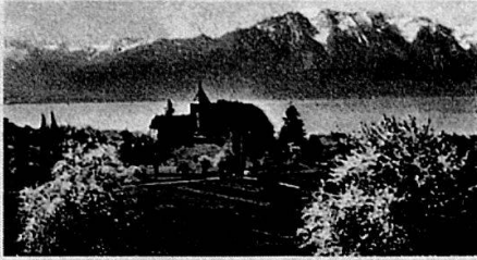
BLONAY - CHATEAU

POSTKARTE CARTE POSTALE CARTOLINA POSTALE