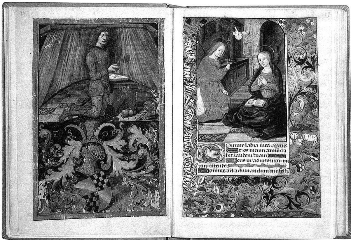
Stundenbuch des Markgrafen Christoph I. von Baden, Pergament. Paris?, Ende 15. Jahrhundert. Badische Landesbibliothek, Cod. Durlach 1, Blatt 18v und 19r.

bebilderte Werk enthält ganzseitige Miniaturen, die das Leben des Lullus und seine Gedankenwelt allegorisch darstellen. Die aus dem Kloster St. Blasien stammende sogenannte Korczek-Bibel stellt einen Höhepunkt böhmischer Buchmalerei dar und ist um 1400 in Prag entstanden. Zu erwähnen sind in dieser kursorischen Aufzählung auch die Texthandschriften – zum Teil aus dem 7. und 8. Jahrhundert – aus der Abtei Reichenau, die 1804 komplett, wie sie dort vorgefunden wurden, nach Karlsruhe gebracht worden waren.