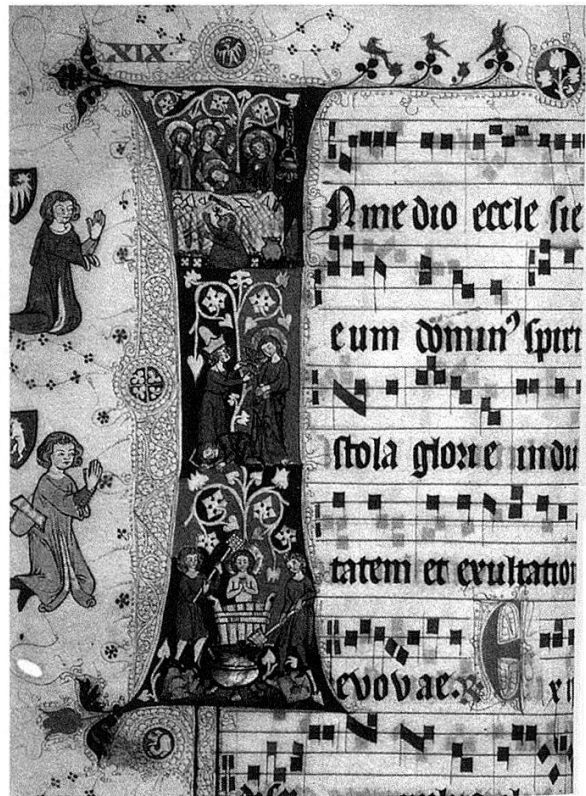
Graduale cisterciense (Wonnentaler Graduale). Pergament. Wonnental im Breisgau, um 1340–1350. Badische Landesbibliothek, Cod. U.H. 1, Blatt 19v. Ausschnitt.

Angesprochen wurde in dieser Stellungnahme des Ministeriums noch ein weiterer Diskussionspunkt zwischen dem Hause Baden und dem Land Baden-Württemberg: die Frage nach dem Eigentum vieler in badischem Museumsbesitz befindlicher Kunstgegenstände, auf die von Seiten des Hauses Baden, vertreten durch den Erbprinzen Prinz Bernhard, Eigentumsansprüche erhoben werden. Auf diese Frage eine eindeutige Antwort zu geben, ist nicht möglich. Zu kompliziert ist die Rechtslage, was unterschiedliche Rechtsgutachten, die in der Vergangenheit dazu in Auftrag gegeben worden waren, belegen. So war es in Baden