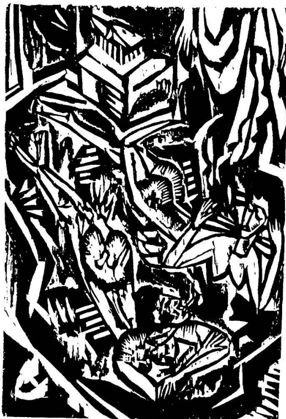
4 Holzschnitt von EL Kirchner («Frauenunterhaltung im Bordell») in: Annemarie und Wolf-Dieter Dube: E. L. Kirchner. Das graphische Werk. 2. Aufl., München 1980, II, S. 39 (Nr. 233 II). 13 × 8,9 cm.

Die Beiträge im Marsyas – neben Döblin unter anderem von Carl Sternheim, Werfel, Hofmannsthal oder Kafka – waren grundsätzlich mit Originalgraphik ausgestattet.