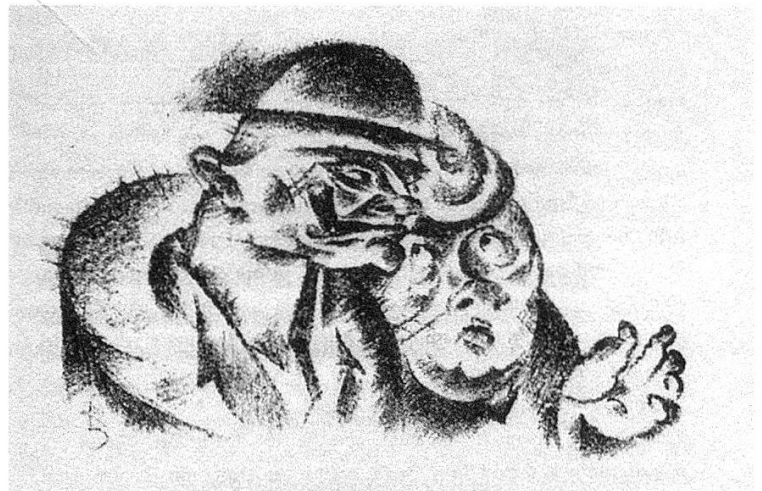
7 Lithographie von Carl Rabus zu Döblins «Das verwerfliche Schwein» in: Alfred Döblin: Blaubart und Mijs Ilsebill . Mit Steinzeichnungen von Carl Rabus ( Das Prisma 10). Berlin: Hans Heinrich Tillgner, 1923, S. 9. 7,5 × 11,6 cm.

Klassiker der Weltliteratur, aber auch zeitgenössische Werke von Kasimir Edschmid, Arnold Zweig oder Ernst Weiß, und zwar stets mit Lithographien illustriert. Für den zehnten Band wurden vier kurze Erzählungen Döblins ausgewählt; den Titel – Blaubart und Mijs Ilsebill – gab eine Novelle aus Die Ermordung einer Butterblume . 16 Die Lithographien zum Döblin-Band schuf der Berliner Künstler Carl Rabus (1898–1983). Die Illustrationen zeigen, dass sich dieser gründlich mit den Vorlagen auseinandergesetzt hat: Der gewalttätige Humor der ersten Erzählung Das verwerfliche Schwein – ein sadistischer Arzt und sein Assistent werden vom Teufel geholt – zeigt sich in den abstoßenden Zügen der Protagonisten (Abb. 7). Die Scham und Einsamkeit Antonie Kowalskis aus Nachtwandlerin , der zweiten Erzählung, sind durch den Bildaufbau veranschaulicht: In die Ecke gedrängt, wird sie von ihrem Liebhaber förmlich erdrückt,