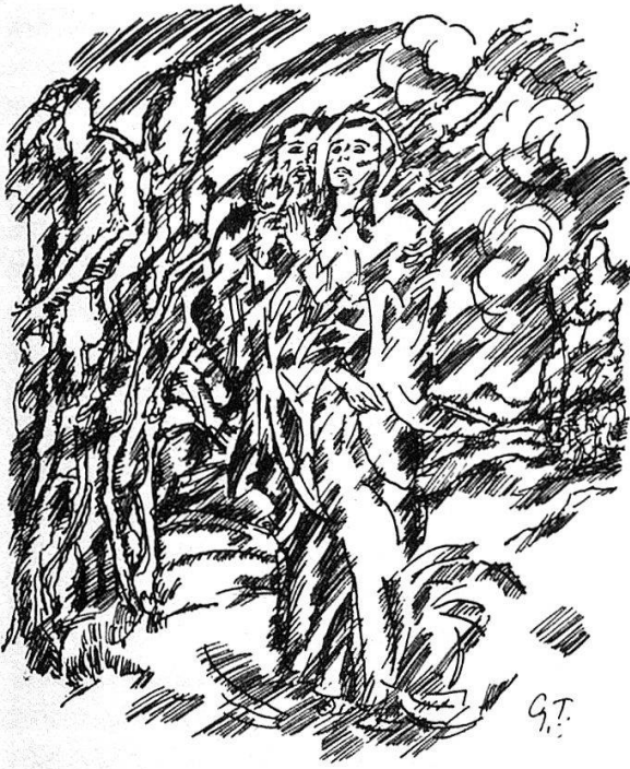
6 Zeichnung von Georg Tappert zu Döblins «Mariä Empfängnis» in: «Die schöne Rarität» 6 (1917), S. [III]. 16,5 × 14,5 cm.

verdeutlicht: Die Figuren, ihre Kleider sowie die umgebende Natur sind durch dieselbe Linienführung eingeebnet (Abb. 6). Die «vegetative» Bildlichkeit der Erzählung wird mit den zeichnerischen Mitteln überzeugend aufgenommen.