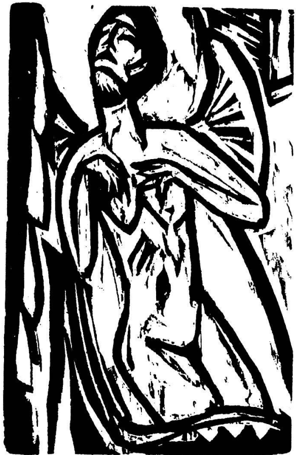
3 Holzschnitt von EL Kirchner («Sterbendes altes Fräulein»). 11,8 × 8 cm.

1917 versammelte Döblin ein weiteres Dutzend zuvor publizierter «Novellen und Geschichten» unter dem Titel Die Lobensteiner reisen nach Böhmen (Georg Müller,