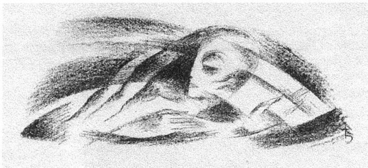
9 Lithographie von Carl Rabus zu Döblins «Ritter Blaubart». Ebd., S. 71. 4,8 × 11,6 cm.

werden. Die Schlussbilder zu Blaubart und Mifs Ilsebill sowie zu Die Segelfahrt zeigen das Aufgehen des Menschen in den Natur- elementen: in den Urkräften des Windes (Abb. 9) oder des Meeres (Abb. 10). Dass dabei beide Seiten von Döblins Prosa jener Zeit – groteske Darstellungen der Großstadt Berlin sowie eigentümliche Märchen- und Legendenstoffe – zum Tragen kom-