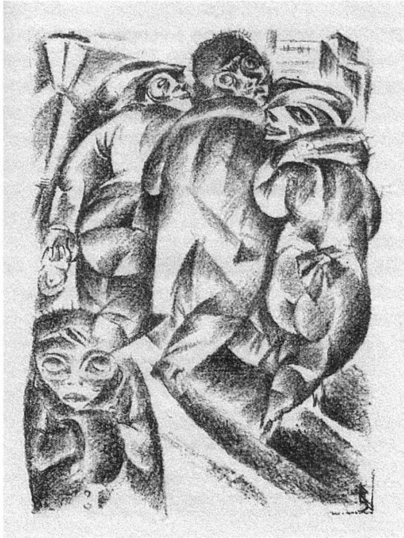
8 Lithographie von Carl Rabus zu Döblins «Die Nachtwandlerin». Ebd., S. [45]. 17 × 11,6 cm.

werden. Die Schlussbilder zu Blaubart und Mifs Ilsebill sowie zu Die Segelfahrt zeigen das Aufgehen des Menschen in den Natur- elementen: in den Urkräften des Windes (Abb. 9) oder des Meeres (Abb. 10). Dass dabei beide Seiten von Döblins Prosa jener Zeit – groteske Darstellungen der Großstadt Berlin sowie eigentümliche Märchen- und Legendenstoffe – zum Tragen kom-