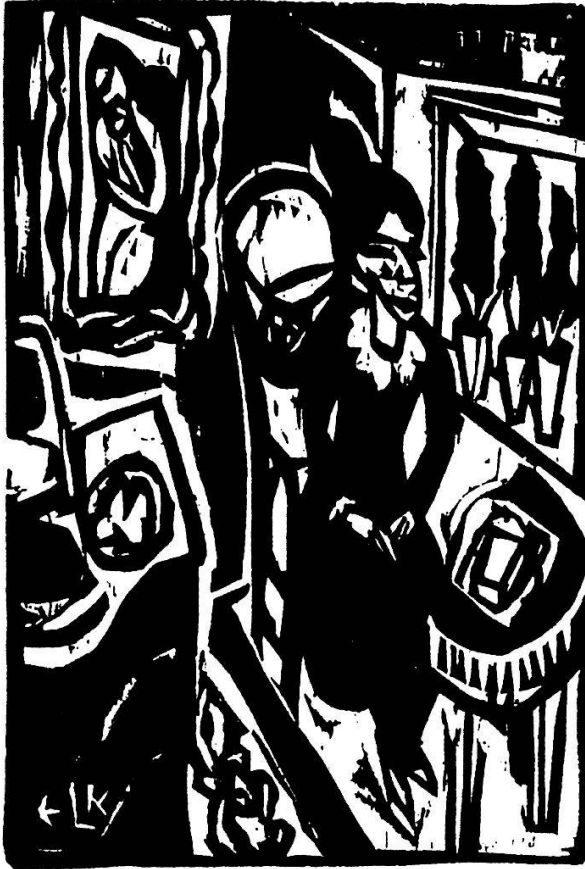
2 Holzschnitt von EL Kirchner («Stiftsfräulein am Nähtisch»). 11,5 × 8 cm.

weiteren, kleinformatigen Schnitten: Stiftsfräulein am Nähtisch (Abb. 2) zeigt die unbewegliche Starre der Klosterfrau, die fernab der Außenwelt hinter ihren Hyazinthengläsern gleichsam in dem Mobiliar ihres Zimmers aufgeht. In Stiftsfräulein im Garten bilden die Spaziergängerinnen zusammen eine dunkle, bedrohliche Fläche. Die helle, nackte Gestalt des Fräuleins steht in Stiftsfräulein im See im Zentrum, umgeben von bedrohlich gezackten Formen. Im letzten Bild des Zyklus – das an eine Pietà -Darstellung erinnert – liegt die sterbende Klosterfrau schutzlos, nackt und verletzlich da (Abb. 3).