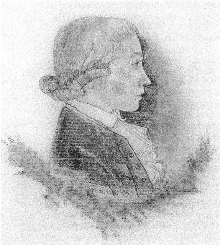
Jugendbildnis Friedrich Hölderlins. Kolorierte Bleistiftzeichnung, 1786. Württembergische Landesbibliothek Stuttgart.

Vietor gütig ausmerzen helfen. 5 – In aufrichtiger Ergebenheit Ihr Stefan Zweig. – Ich würde das Mcpt in 4–5 Tagen absenden, sofort wie ich Bescheid von Ihnen habe. Am besten wäre eine Rücksendung durch die Baseler Bibliothek, weil dadurch die Einfuhrfrage entfiel. 6 Der Briefwechsel Zweigs mit Zinkernagel umfasst über 50 Nummern und währt, mit einem Unterbruch von 1929 bis 1934, bis zum März 1935, ein halbes Jahr vor Zinkernagels frühem Tod.