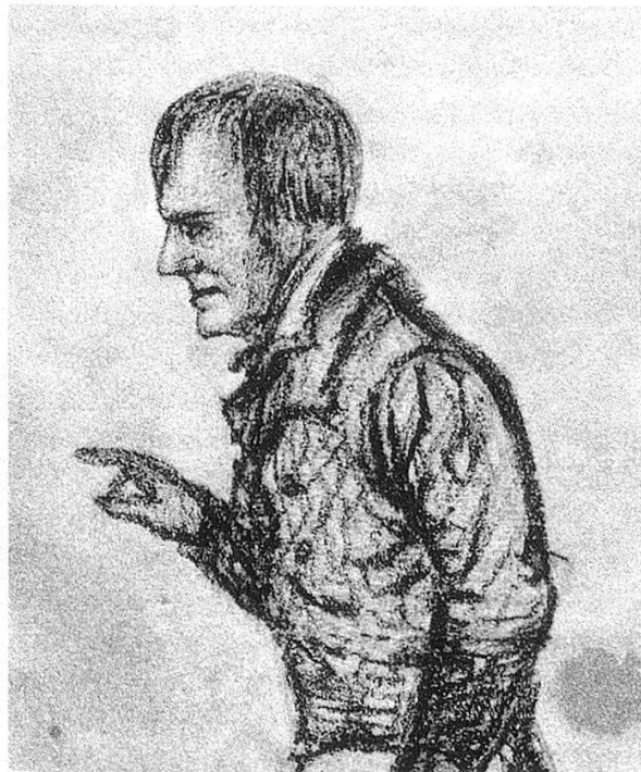
Altersbildnis von Friedrich Hölderlin. Bleistiftzeichnung von G. Schreiner. Goethe-Museum Frankfurt am Main.

Außer diesen beiden Briefwechseln haben sich im Nachlass Zinkernagels der Basler Universitätsbibliothek Briefwechsel mit fernen und lokalen Kollegen erhalten, von wissenschaftlichem Interesse die einen, von universitätsgeschichtlichem die andern. Einige Briefwechsel befassen sich mit der Auffindung von handschriftlichen Quellen für Zinkernagels Hölderlin-Ausgabe mit Bibliotheken, Museen, privaten Sammlern und Erben aus der Nachkommenschaft des Dichters. Über 430 Briefe und Karten umfasst der Briefwechsel mit dem Insel-Verlag,