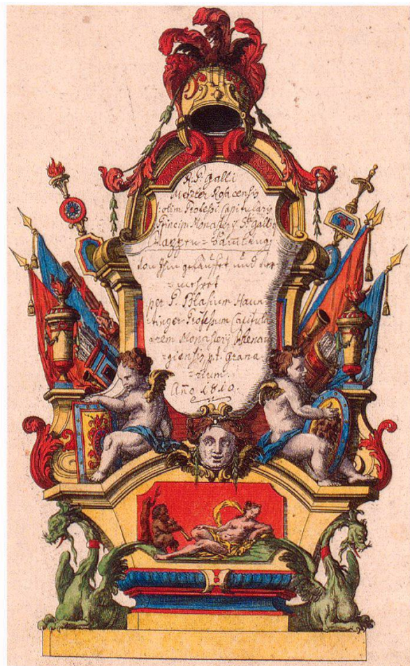
3 Ms. Rh. hist. 33a, Wappensammlung von P. Gallus Metzler, vermehrt von P. Blasius Hauntinger.

Leider sind auch die durch den Rheinauer Bibliothekar und Archivar Pater Basilius Germann (1727–1794) erarbeiteten Verzeichnisse, welche die Handschriften