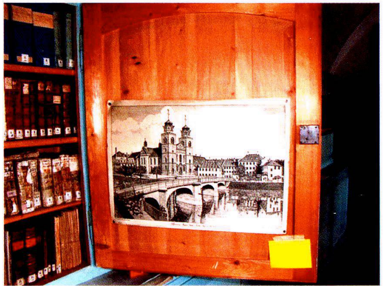
1 Aufnahme aus dem Klosterarchiv Einsiedeln mit Rheinauer Handschriften und Archivalien, Locatur A.1.A.

Die Klosterbrüder durften bei ihrem Austritt ebenfalls nachweisbares Privateigentum mitnehmen, darunter auch Bücher. Akten, welche die Klosterkirche, die zugehörigen Pfarreien, Reliquien, Ablässe, Bruderschaften und Paramente betrafen, gelangten ins Pfarrarchiv von Rheinau. Henggeler ist sich dabei allerdings nicht ganz sicher, denn er schreibt ausdrücklich «unseres Wissens». 3 Was im Kloster Rheinau verblieb, wurde gemäß Beschluss des Großen Rats des Kantons nach Zürich überführt, die Archivalien ins Staatsarchiv, die Bücher in die Kantonsbibliothek, die 1916 mit der Stadtbibliothek zur heutigen Zentralbibliothek zusammengefasst wurde. Über die im Staatsarchiv Zürich aufbewahrten Dokumente gibt das online zugängliche Findbuch von Meinrad Suter zum Archiv des Benediktinerklosters Rheinau des 9.-19. Jahrhunderts Auskunft. Das Staatsarchiv Zürich übernahm das Klosterarchiv, heute 331 Bände, 133 Mappen, 26 Hefte. Laut Findbuch betreffen die im Staatsarchiv liegenden losen Akten (J 1-123) und Bände (J 124-435) ihrem Entstehungszweck