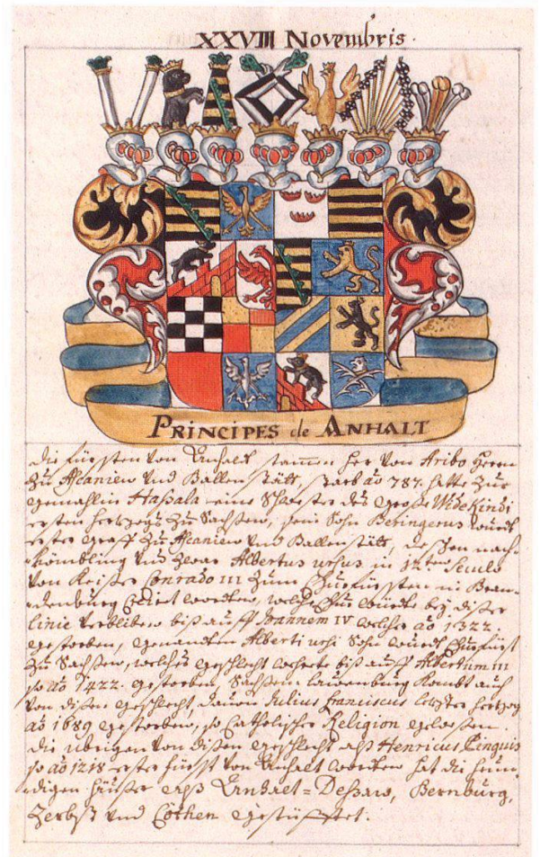
4 Ms. Rh. hist. 34, Johann Adam Heinrich Haughk, Europäischer Wappen- und Staats-Kalender.

Deutsch sowie einzelne in Italienisch und Englisch). Aufgestellt unter der Signatur RRF umfasst sie vor allem Drucke des 18. Jahrhunderts, wenige auch aus dem 16. bis 17. und aus dem 19. Jahrhundert. In der Gruppe sind alte gedruckte Handschriftenverzeichnisse und Bibliothekskataloge sowie Werke zu Buchgeschichte, Buchwesen und Diplomatie zusammengefasst.