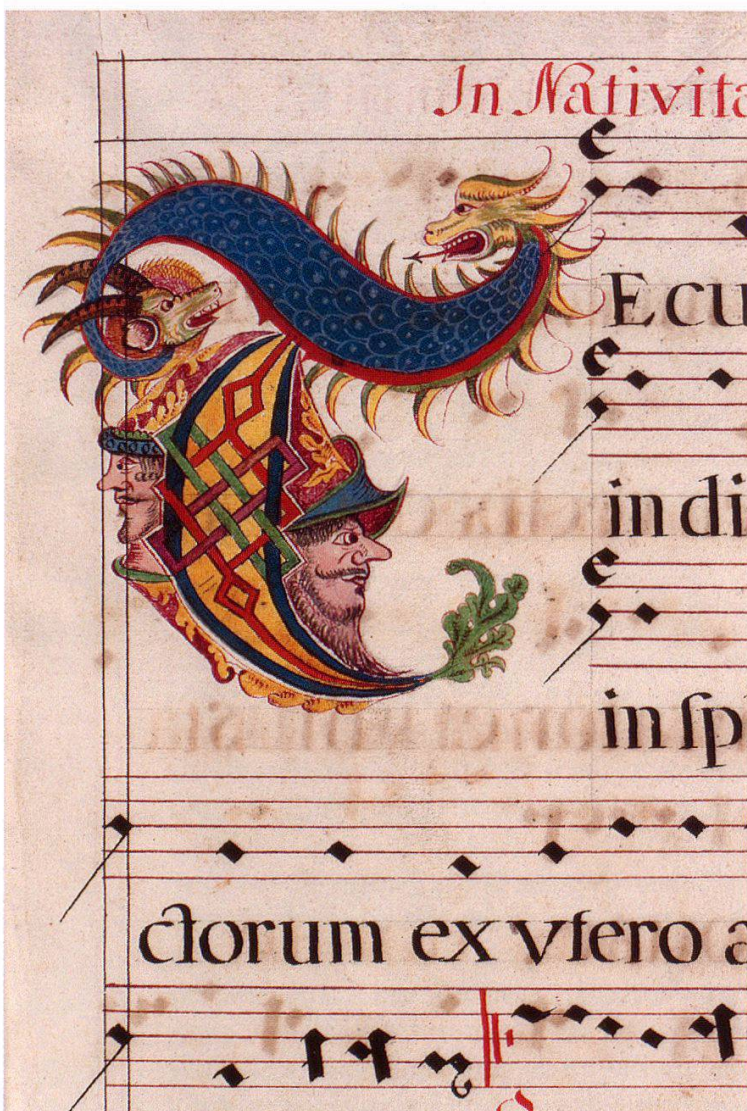
5 Initiale mit doppelköpfigem Mann und Drache zu Weihnachten. Seite 53.

Golgatha, das ist die Schädelstätte, wie es in den Evangelien heißt, der Schädel und die gekreuzten Knochen weisen darauf hin. Mit den drei Würfeln zogen die Soldaten um das Gewand Christi das Los. Das Gewand hängt fein säuberlich an einem Bügel an der Säule, die Keule und das Schilfrohr 12 sind am gleichen Ort platziert, darüber die Fahnen der Soldaten. Dem Verrat und der Szene im Garten Gethsemane sind manche der Symbole gewidmet; die dreißig Silber-