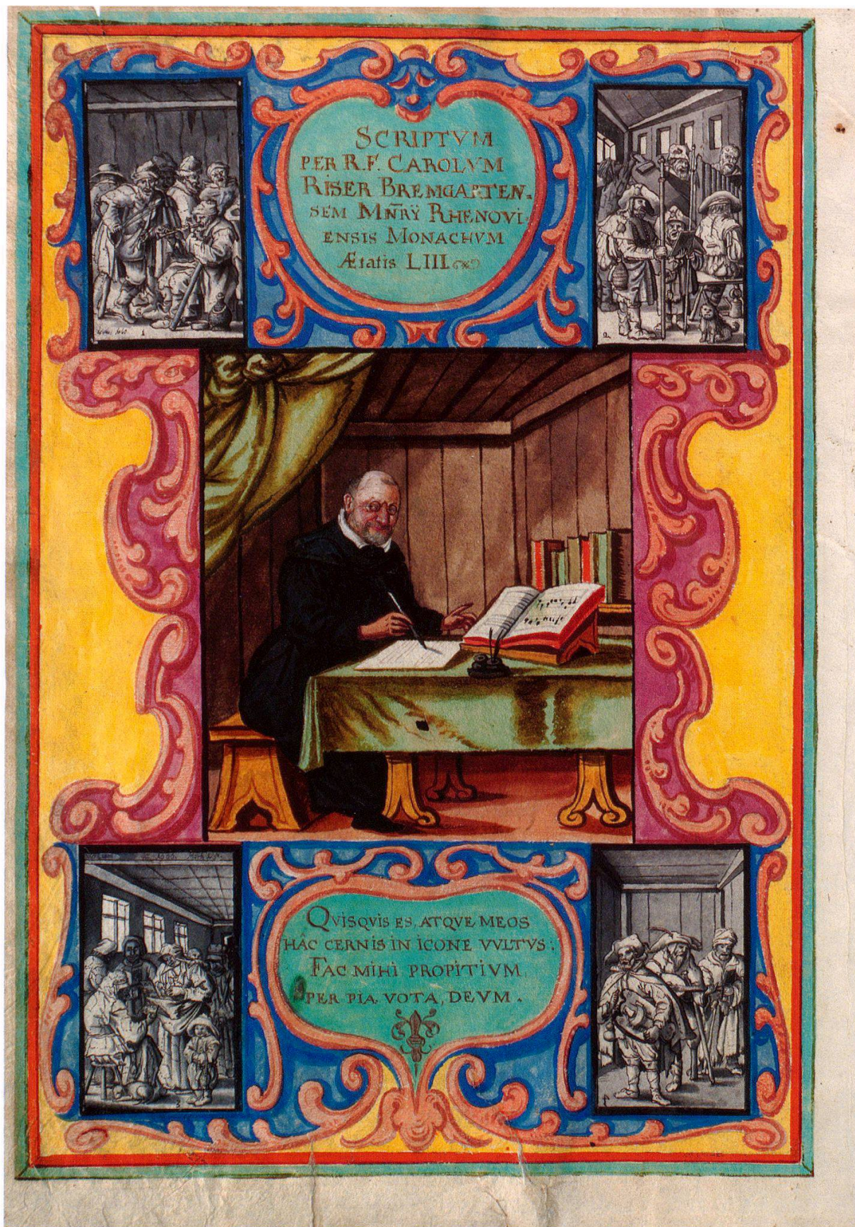
2 Der Pater Carolus Riser «im Gehäuse» als Schreiber und Maler. Folio IIIv.