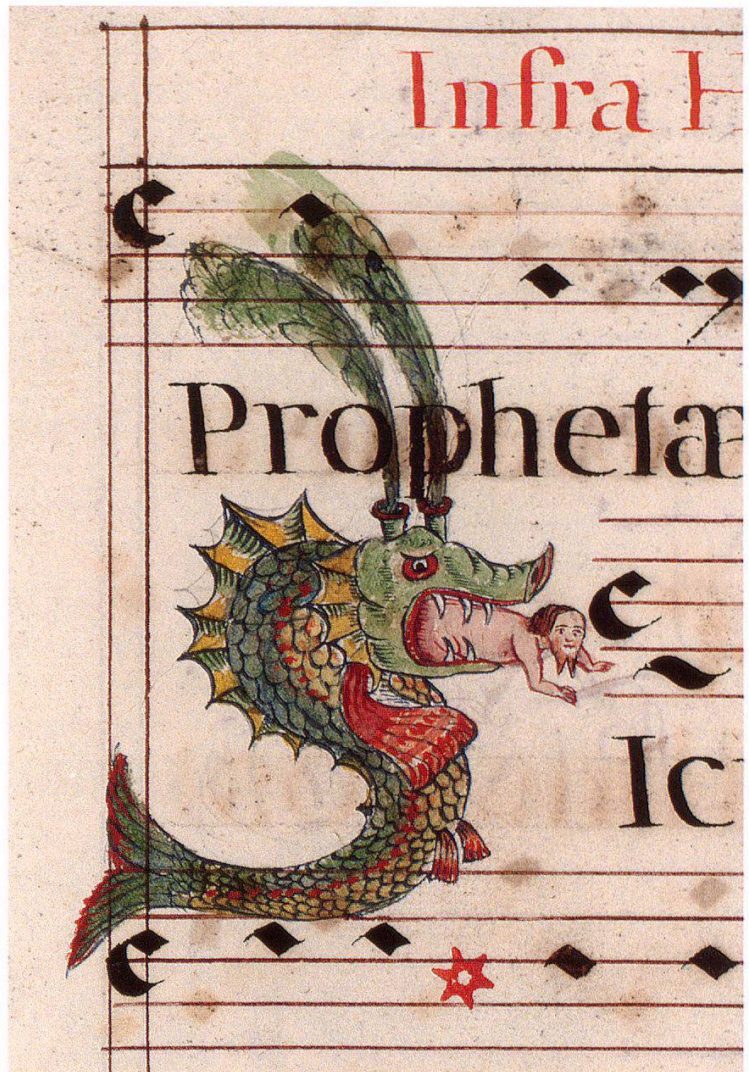
6 Jonas im Walfisch als Drachen zur Passion und Auferstehung. Seite 115.

Es gehört nicht im engeren Zusammenhang zum Antiphonar von Carolus Riser, wohl aber ist das Wappenbuch Ms. Rh. hist. 33a in der Ausstellung «Gelehrte Mönche im Kloster Rheinau» ausgelegt. «Insignia Christia» ist der kolorierte Stich mit den Arma Christi überschrieben, das Wappen Christi also, wie es seit dem 14. Jahrhundert geläufig ist und auch als Wappenscheibe auftaucht. Das Wappenbuch ist im 18. Jahrhundert angelegt worden und 1810 von P. Blasius Hauntinger ergänzt worden. «In disem Wappen Schild wird dir schön / vor gebildet, in wem eins Christen Adel sey, / durch was uns Christus gmacht hat frey», steht auf einem Schriftband geschrieben. Das Bild der Arma Christi lädt die Mönche in der Karwoche