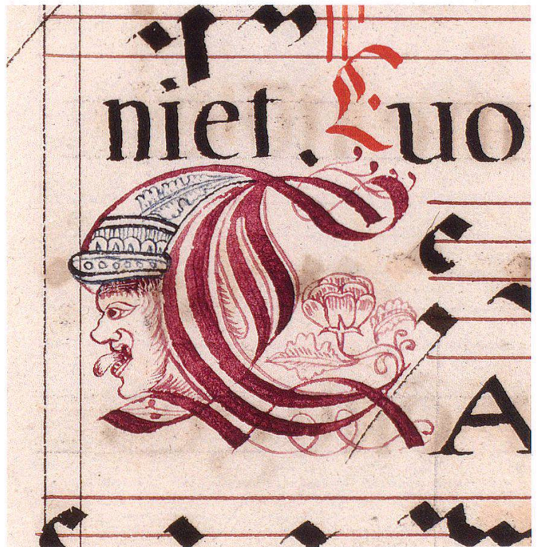
4 Initiale als Lällekönig. Seite 17.

Andere Bildinitialen haben einen inhaltlichen Bezug zum Antiphon, das sie einleiten; es sind bezeichnenderweise nicht die besten. Zur Epiphanie erscheint das Jesuskind mit Kreuzstab in einem Strahlenkranz, der von Adler-Drachen attackiert wird. Ein Dudelsack spielender Narr auf einem Fuchs markiert die Fasnacht am Samstag vor Aschermittwoch (S. 100). Jonas im Walfisch zu Passion und Auferstehung gerät besonders abenteuerlich, der Walfisch wird zu