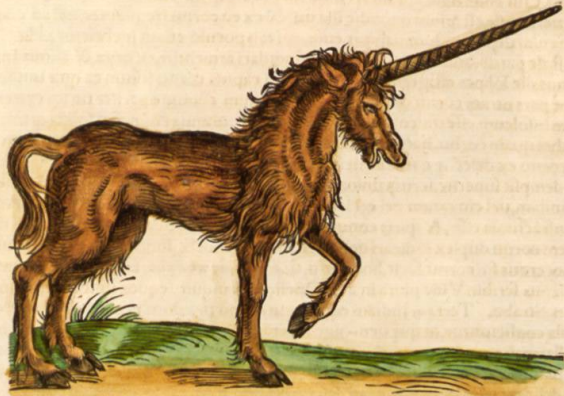
Figura hæc talis est, qualis à pictoribus ferè hodie pingitur, de qua certi nihil habeo.