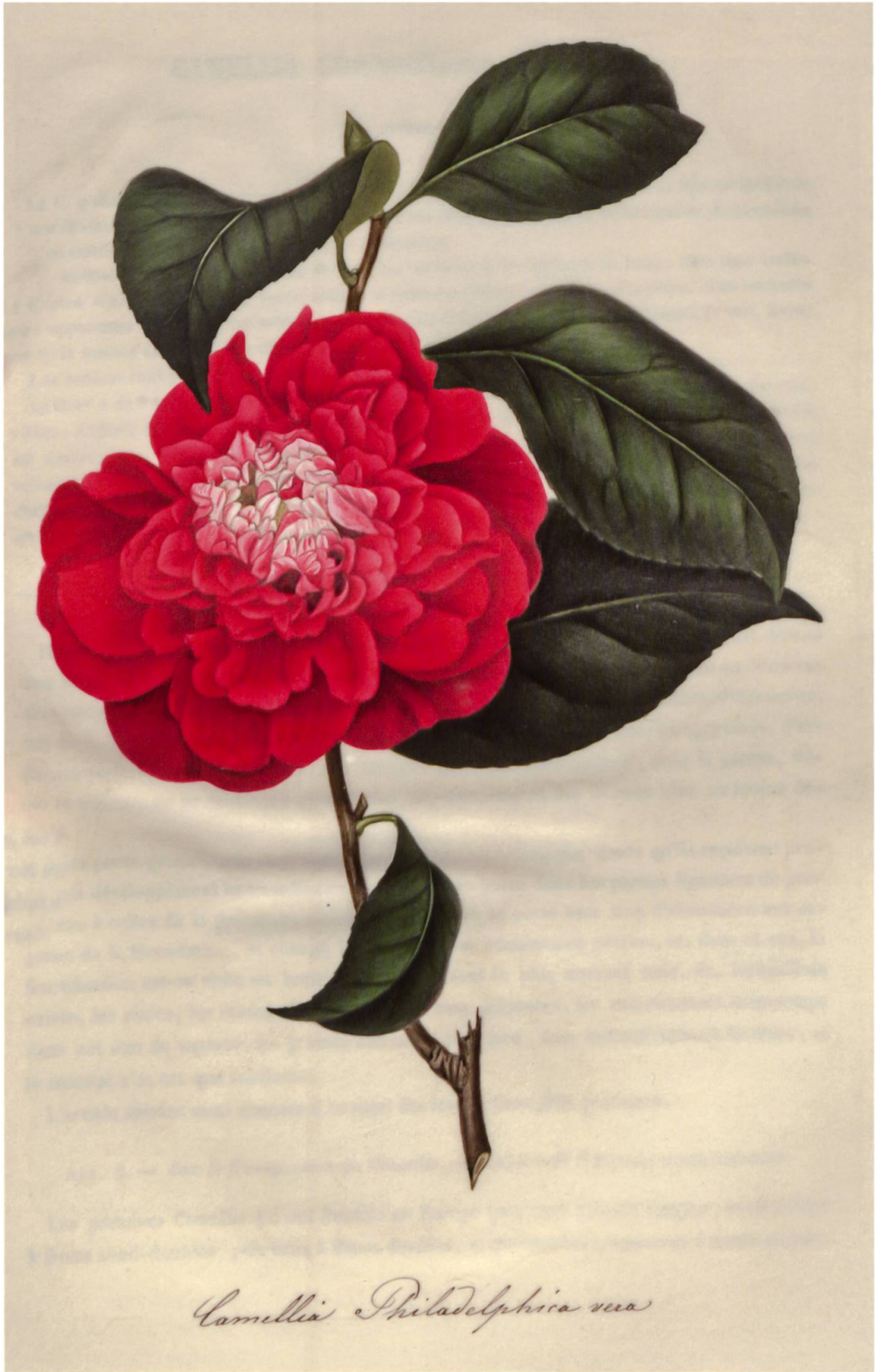
Camellia Philadelphica var.