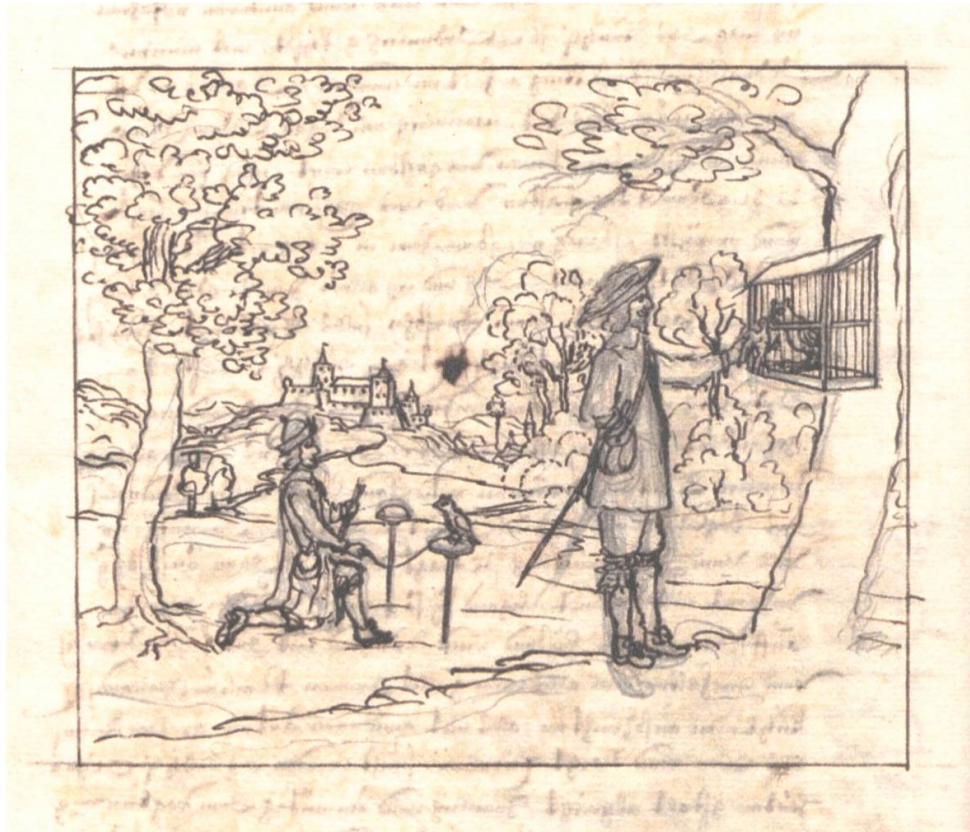
Fütterung und Abrichtung des Lockkauzes, aus: Kunst Weydny oder Vogell Buch , Universitätsbibliothek Basel, K II 6.1, f 3v, vgl. f 3v der Zürcher Vorlage (S. 107, Abb. 3).

in das Kloster Kappel getragen, dem Schaffner geschenkt und anschließend Zürichs Gnädigen Herren verehrt wurde (Bericht f 57v), werden auch Oesenbrys Beziehungen zum Kloster Kappel untersucht. Schließlich wird Oesenbrys Vogeljagdbuch aus heutiger ornithologischer Sicht betrachtet.