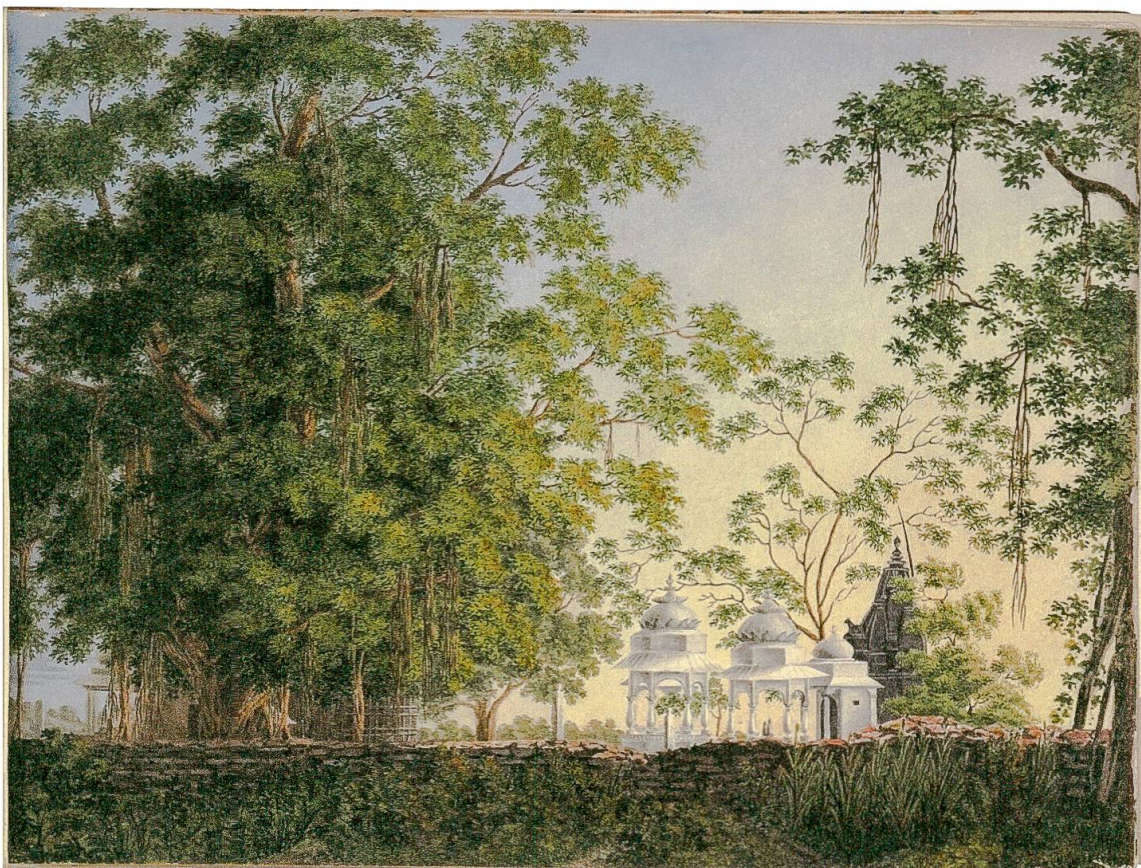
Abb. 2: Banyanbäume mit Tempelanlage, Aquarell und Gouache, Skizzenbuch. – Burgerbibliothek Bern, FA von Wild o. Nr.