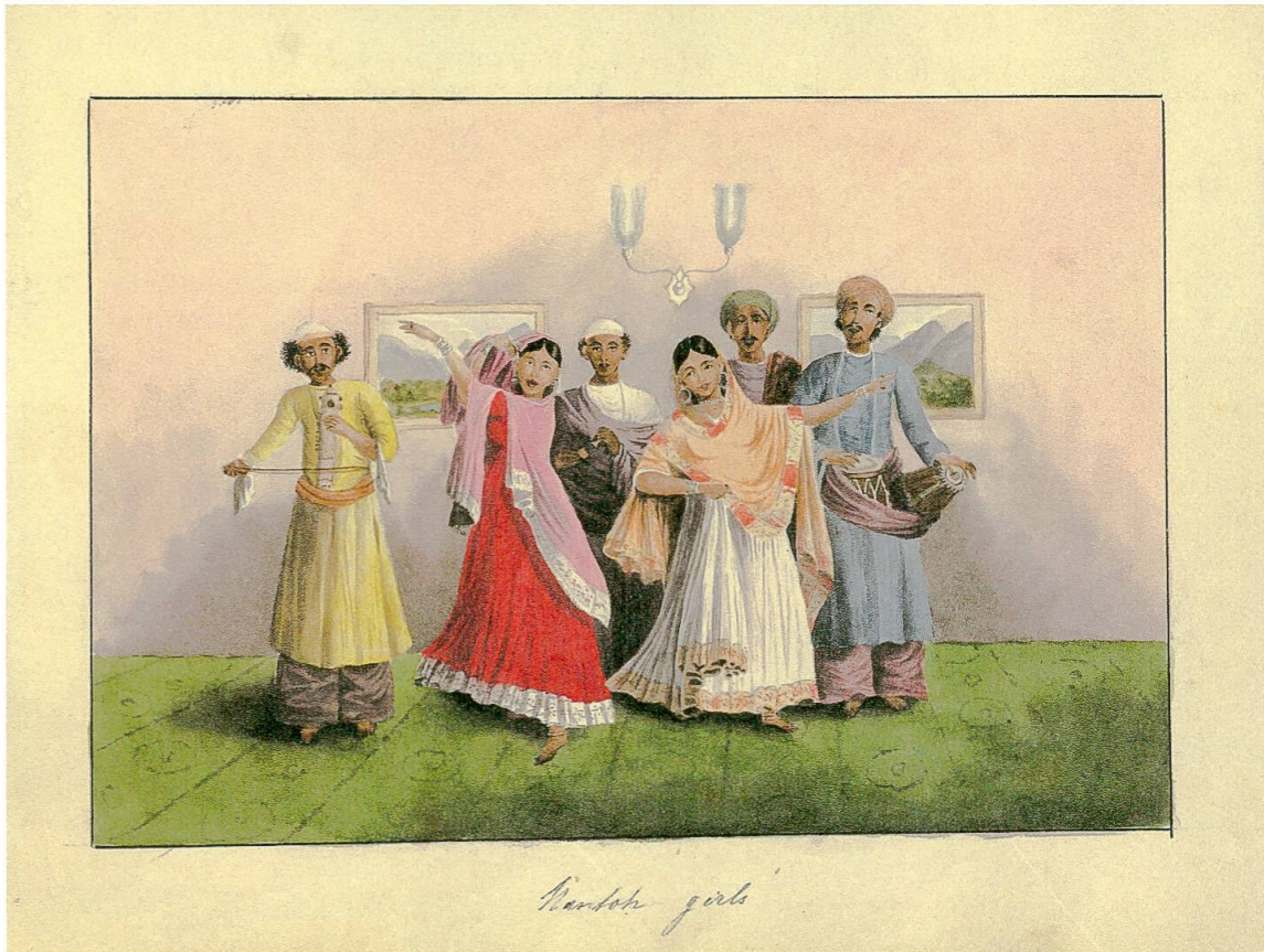
Abb. 1: Indische Tänzerinnen und Musiker, Aquarell und Gouache, Skizzenbuch.