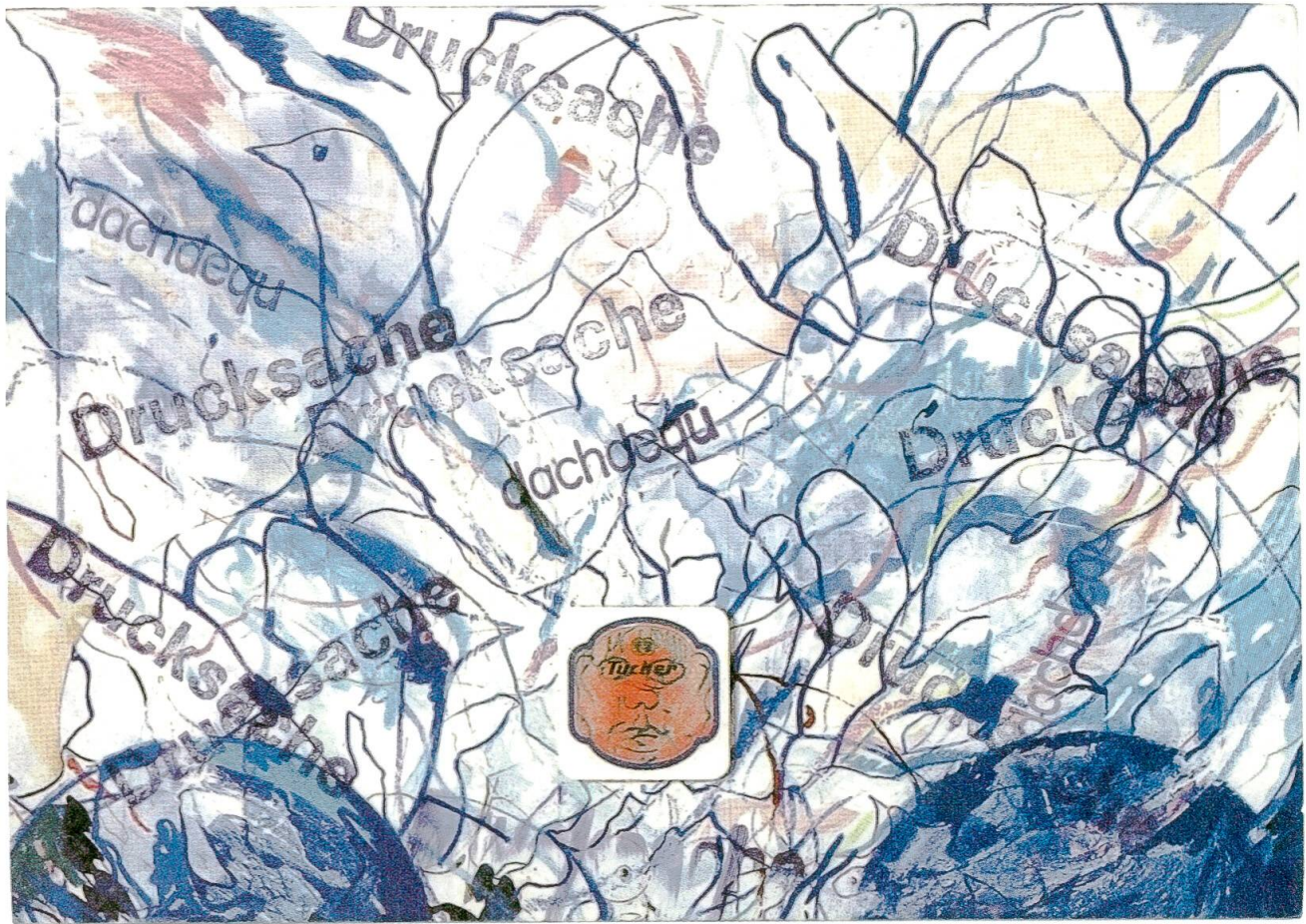
Abb. 3: «Drucksache» – der mit «Drucksache» mehrfach gestempelte Neujahrsgruß vom 26. Januar 1998 an Peter Friedli zeigt die tiefe Verbundenheit der beiden Persönlichkeiten. Das Bild auf der Schauseite stammt aus dem druckgrafischen Œuvre von Daniel de Quervain. Zugrunde liegt eine Radierung de Quervains in wunderbar winterlichen Blau- und Weißtönen, durchsetzt von kaltem Rosa und zartem Beige. Die auf den ersten Blick wilden Linien, abwechselnd in kräftiger Strichführung und haarfeinen Linien, die sich stellenweise im Weiß zu verlieren scheinen. Die Linien fokussieren in der unteren Bildmitte auf eine witzige Maske, die als kleine rostrote Vignette mitten im Bild steht. Die kleinformatige Darstellung zeigt in ihrer Linienführung die einmalige künstlerische Handschrift Daniel de Quervains. (Burgerbibliothek Bern, N Daniel de Quervain o. Nr.)

ten, kann er doch durch stärkeren oder geringeren Druck während des Ritzens breite wie auch haarfeine Linien ziehen und großflächige Hintergründe in Ätztechnik gestalten.