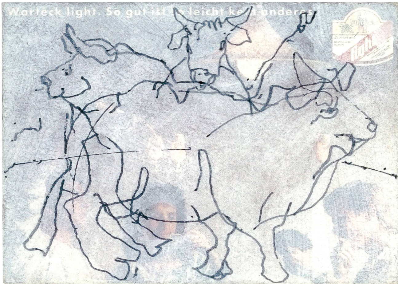
Abb. 4: «Zwei Stiere» – unter diesem Titel erscheint 1957 Daniel de Quervains erstes künstlerisches Blatt, das er auf Anregung seines Lehrers an der Berner Kunstgewerbeschule, Eugen Fördi (1894–1983), lithografiert und vervielfältigt. Tiere und Pflanzen bilden fortan im Schaffen von Daniel de Quervain eine reiche Inspirationsquelle und vielfach abgewandelte Bildmotive. Die Postkarte vom 1. März 1999 nimmt das Motiv auf und zeigt in einmaliger Komposition und gekonnter Strichführung drei Stiere auf durchscheinend geweißtem Untergrund. (Burgerbibliothek Bern, N Daniel de Quervain o. Nr.)