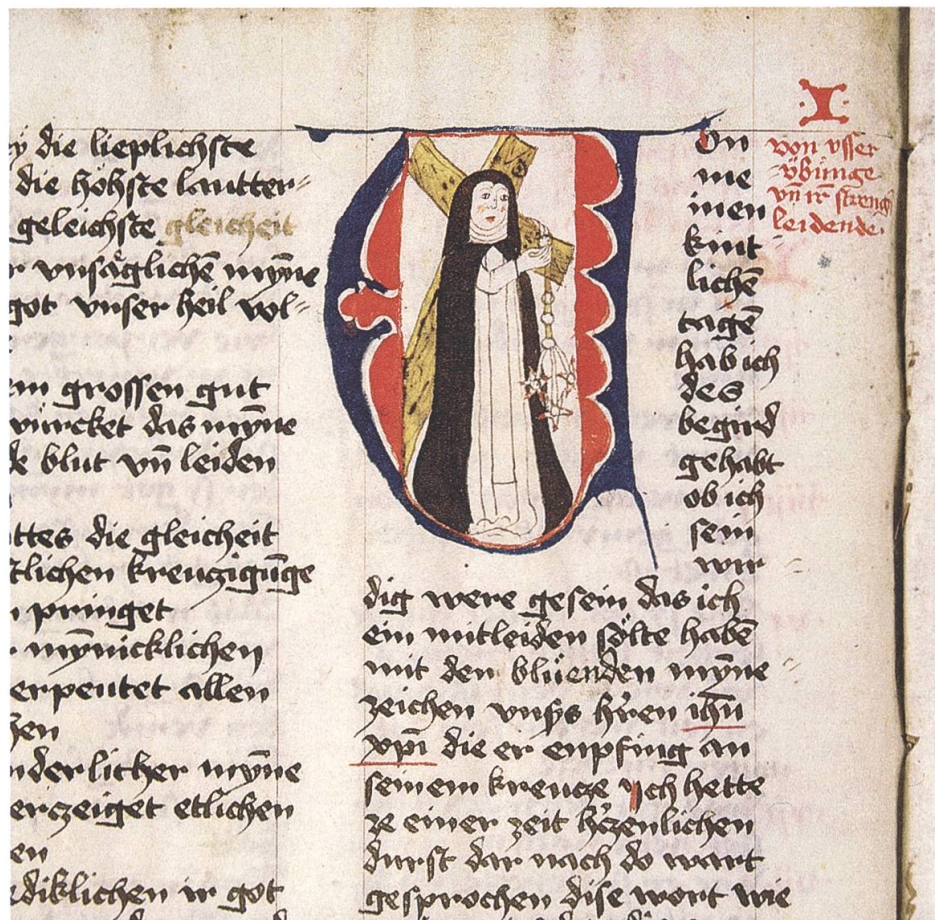
Vita der Elsbeth von Oye in Cod. IV F 194a der Universitätsbibliothek Breslau: Initiale V, Elsbeth mit Kreuz und Geißel (Bl. 1 v ).

Schweiz. Ich hielt durch bis zur deutschen Grenze, bis Görlitz. Dort hielt der eingewechselte Schaffner den Zug auf, bis die eilends gerufene Ambulanz kam, mich aus dem Abteil trug und ins Städtische Klinikum brachte. Diagnose: weit fortgeschrittener Blinddarm-Durchbruch.