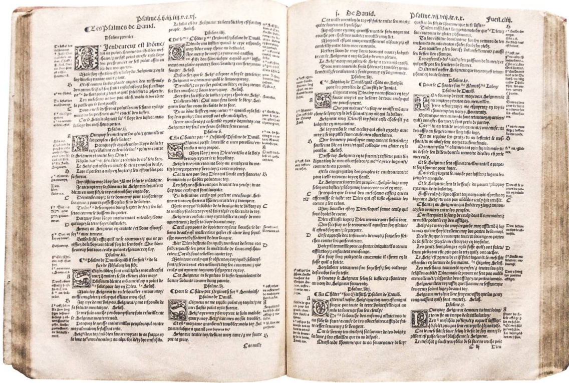
III. 1: La Bible, Neuchâtel, Pierre de Vingle, 1535, f° CLIIv - CLIIIf, le début du livre des Psaumes.