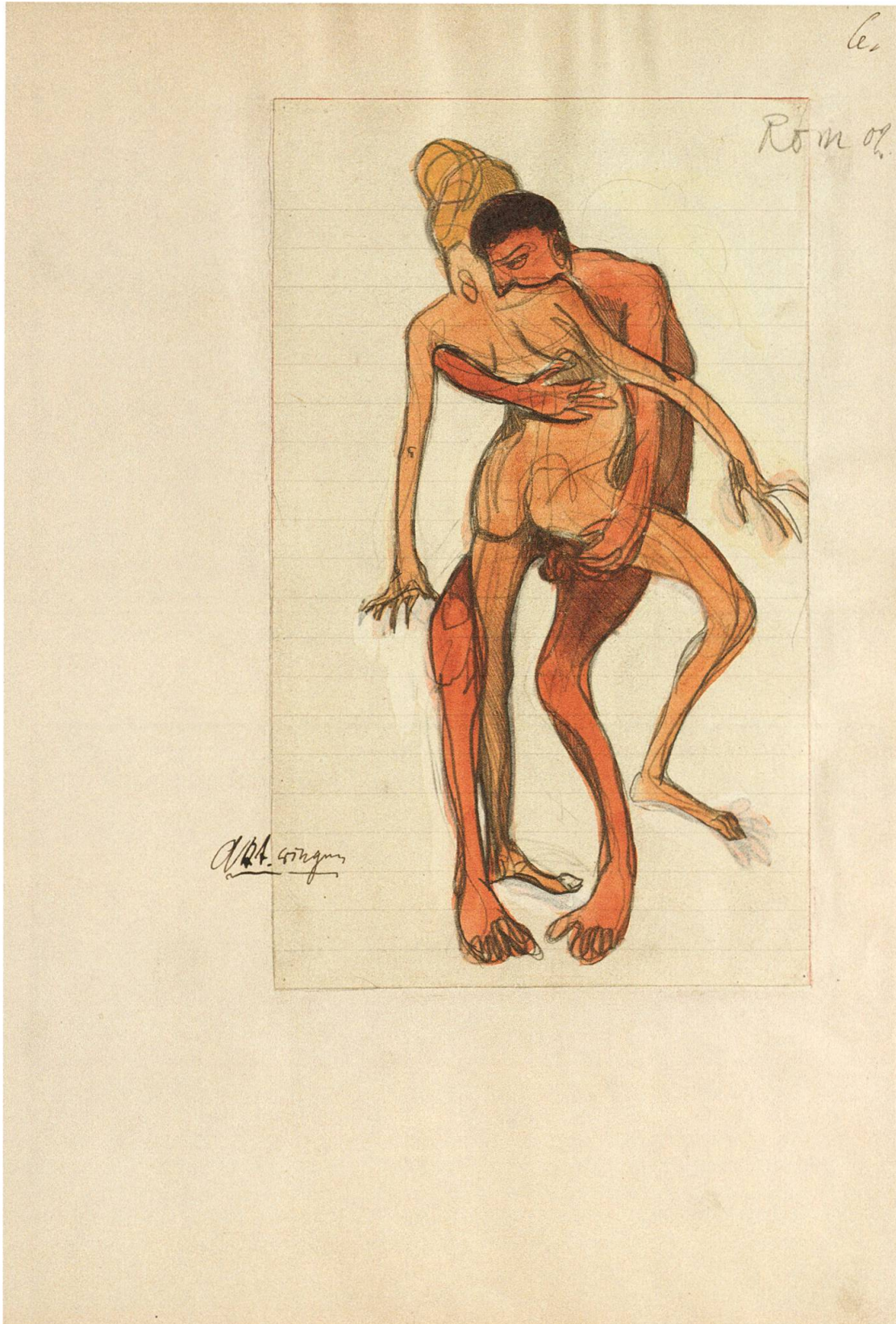
Abb. 4: Burgerbibliothek Bern, FA Bloesch, Das Buch , fol. 6r.