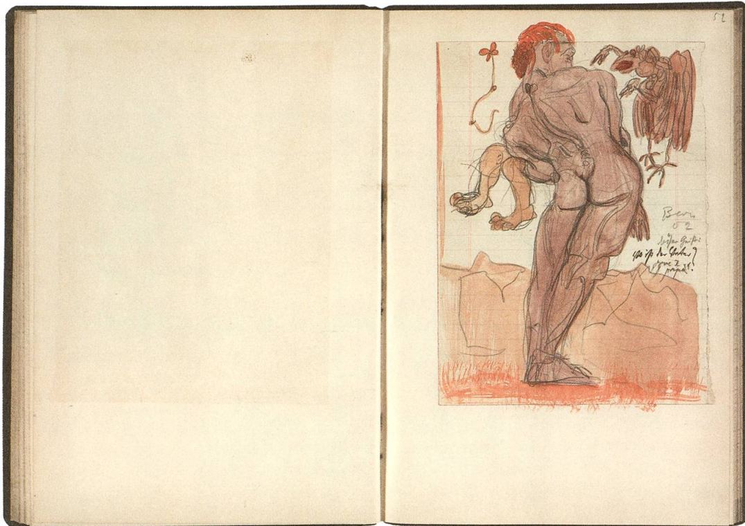
Abb. 3: Burgerbibliothek Bern, FA Bloesch, Das Buch , fol. 51 v -52 r .