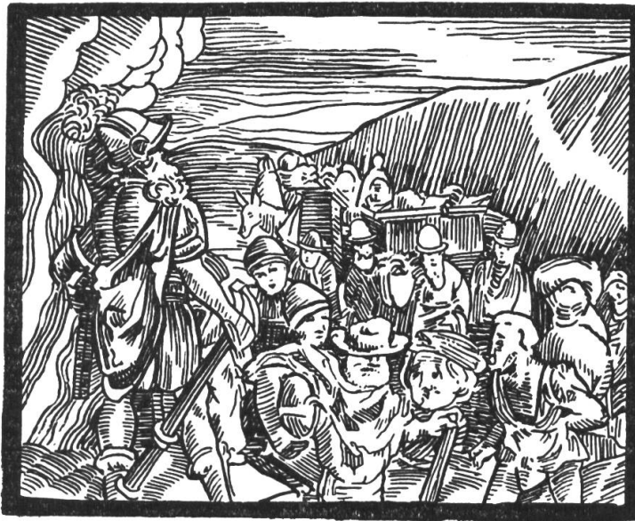
Der Zug der Kinder Israel durch den Jordan.