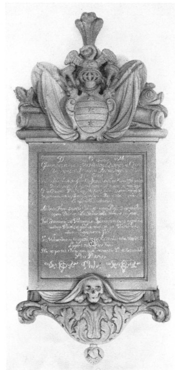
Grabplatte und Epitaph des Nicolaus Quifard