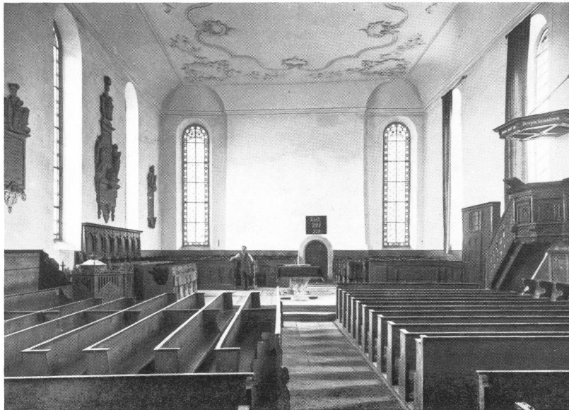
Chor und Vorderchiff der Kirche vor der Renovation 1903

(Man sieht deutlich die Bretter, womit die Grabplatten überdeckt waren. Links die drei Grabdenkmäler, rechts die Kanzel)