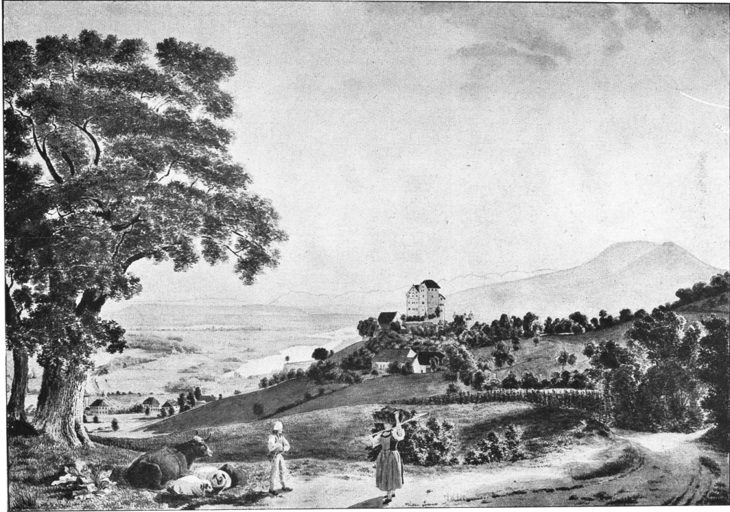
Schloß Wildegg von Süden. Nach einem Aquatell von Em. Rud. von Effinger aus dem Anfange des 19. Jahrhunderts