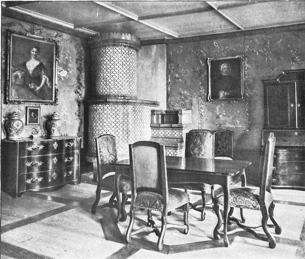
Die «gelbe» oder «Salis-Stube», das Sterbezimmer der Marie-Louise im Schloß Wildegg