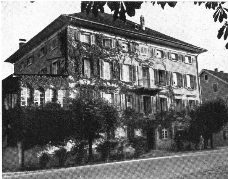
Das ehemalige Gasthaus zum Rößli (in Othmarsingen), wo Strindberg wohnte (Heute: Wohnhaus Salzmann)