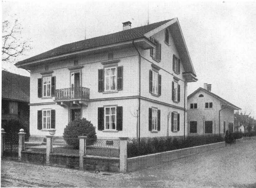
Der Talgarten zur Zeit Heidenstams