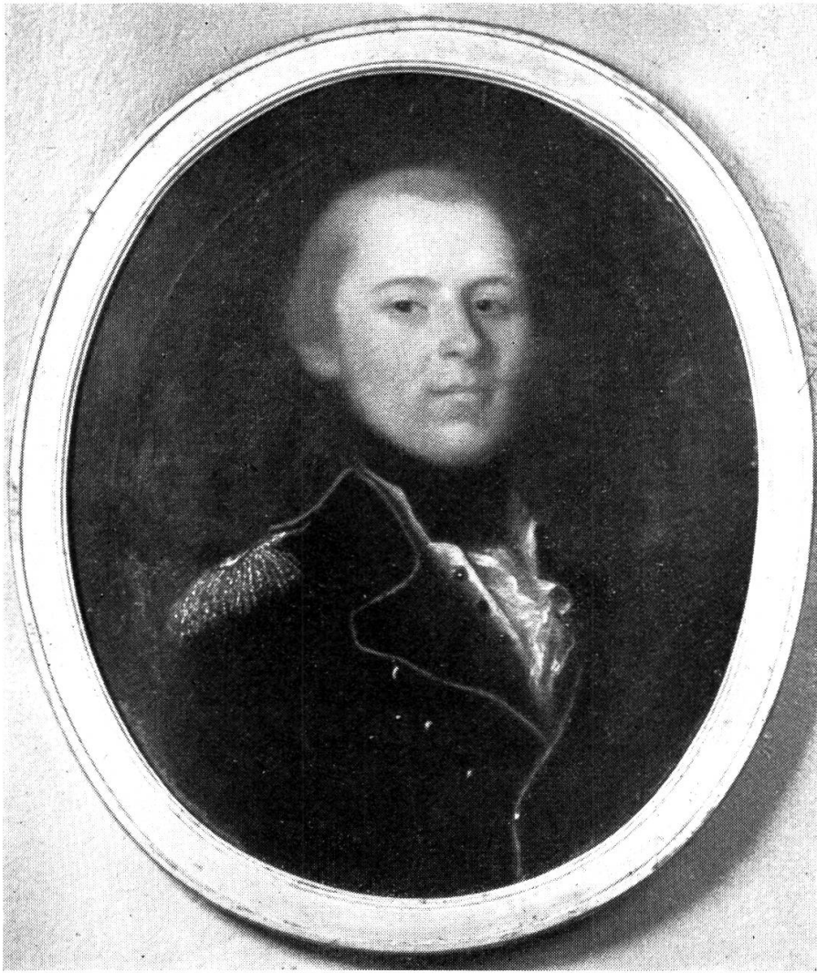
Gottlieb Heinrich Hünerwadel (1769–1842)