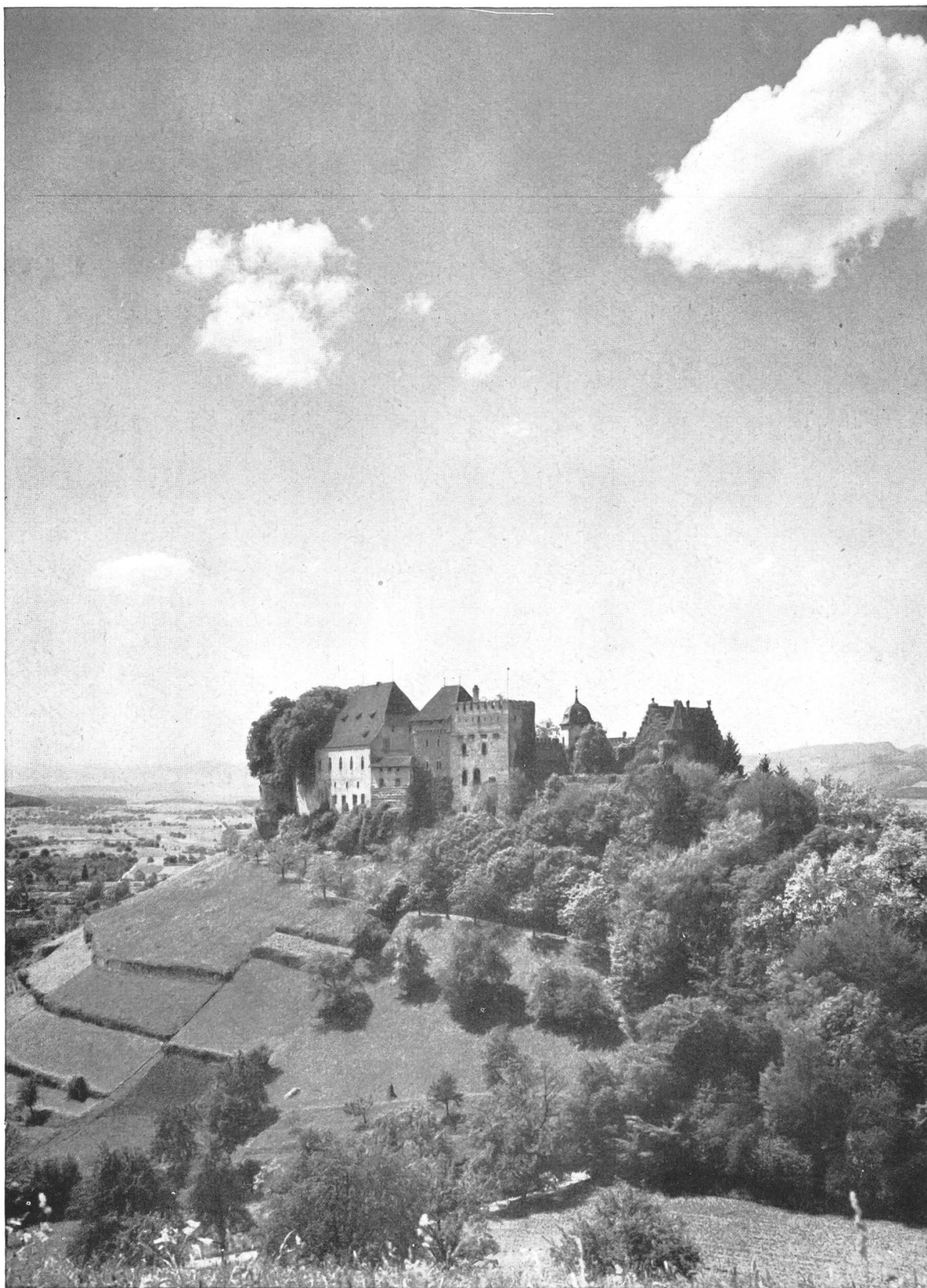
Schloß Lenzburg aus „Die Kunstdenkmäler des Kantons Aargau“ Band I. Verlag Birkhäuser, Basel