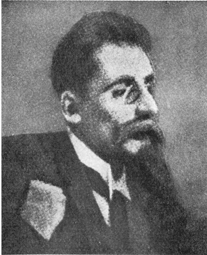
Wedekind in der Scharfrichterzeit