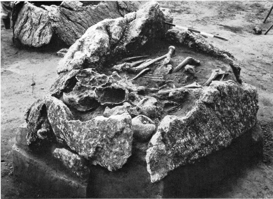
Grab mit sieben festgestellten Hockern Bei früheren Wegarbeiten war diese Steinkiste teilweise beschädigt worden